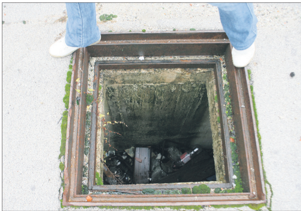
Ni prijetno, če kakšna noga zaide v takšno luknjo ...

Mi smo našli najmanj pet lukenj. Čeprav ne bi smeli, hodijo mimo njih tisti, ki gredo po bližnjici na malico.