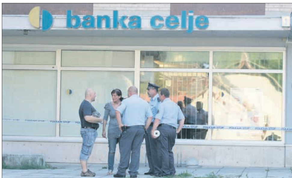
Ropar je pobegnil peš?