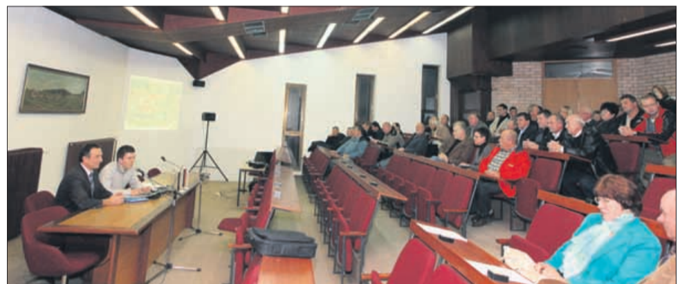
Na drugi strani Pešnice, v občinski sejni dvorani, je bilo vzdušje precej bolj umirjeno. Tisel se ob dejstvu, da nasprotnika ni bilo, ni dal motiti in je »soočenje« vseeno izpeljal. Za gostinski del druženja pa so poskrbeli pred občino.