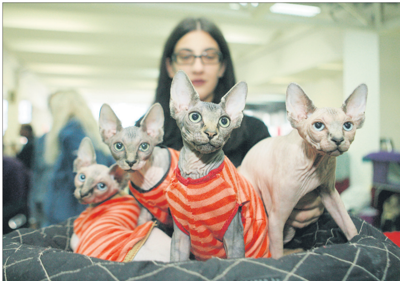
Prave mačje manekenke ... Čeprav mnogi menijo, da gole muce niso ravno privlačne na pogled, postajajo vse pogostejše hišne ljubljence.