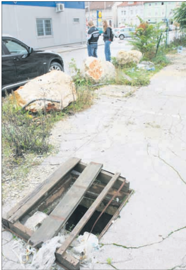
Zavarovano ali nezavarovano? Nevarno.

Gre za območje med Rakuschevim mlinom in stavbo nekdanjega Kuriva. Na tem delu smo namreč našli okrog pet nevarnih jaškov, ki so popolnoma nezavarovani. Obe stavbi sta zapuščenima, vendar to ne pomeni, da tam nikogar ni.