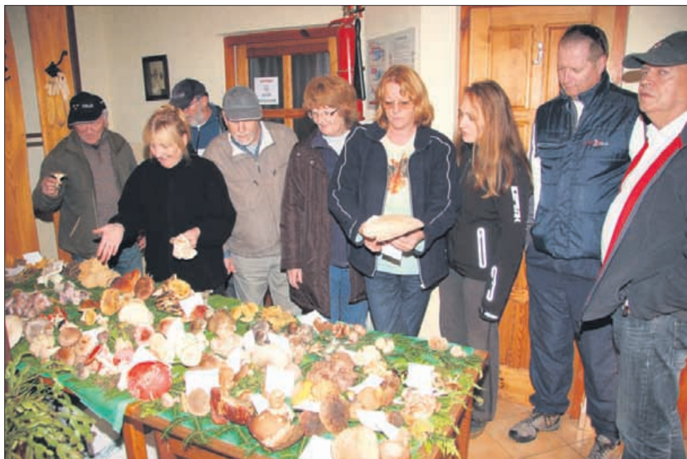
Novinarji in gobarji so razstavo gob pripravili v rekordnem času.