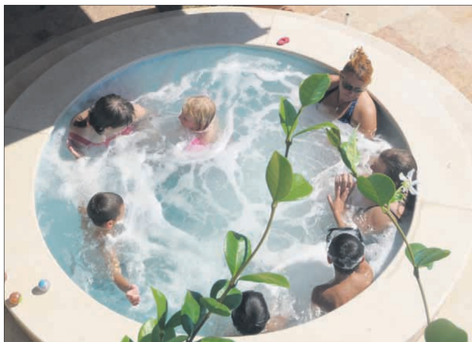
Otroci so v Portorožu uživali v bazenu vile