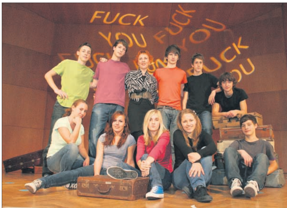
Člani angleške gledališke skupine Have Fun Club Gimnazije Celje - Center so se izkazali v predstavi Lovec v rži , ki so jo v torko premierno uprizorili na odru Celjskega doma.