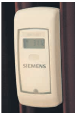
Nakup in vgradnja delilnika predstavlja strošek lastnika stanovanja. Delilnik stane med 30 in 40 evri, pri čemer je treba ta znesek pomnožiti s številom radiatorjev v stanovanju.

V vsaki večstanovanjski stavbi so tudi skupni stroški (skupni prostori, toplotne izgube ...). Ti se določijo s pisnim sporazumom med etažnimi lastniki, ki ga mora podpisati večina lastnikov. Pri tem morajo upoštevati Pravilnik o načinu delitve in obračunu stroškov za toploto v stanovanjskih in drugih stavbah z