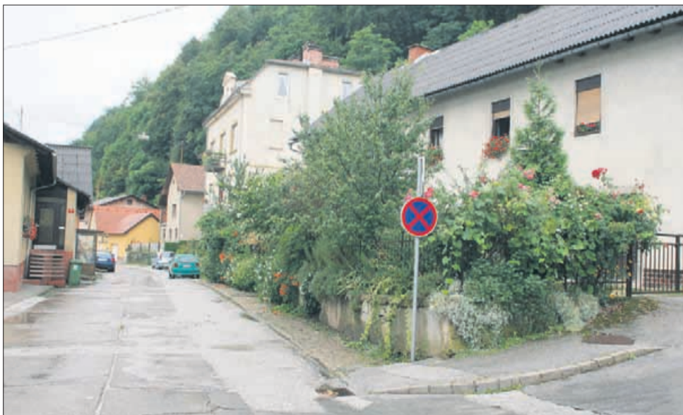
Breg v Celju bo kmalu postal gradbišče.