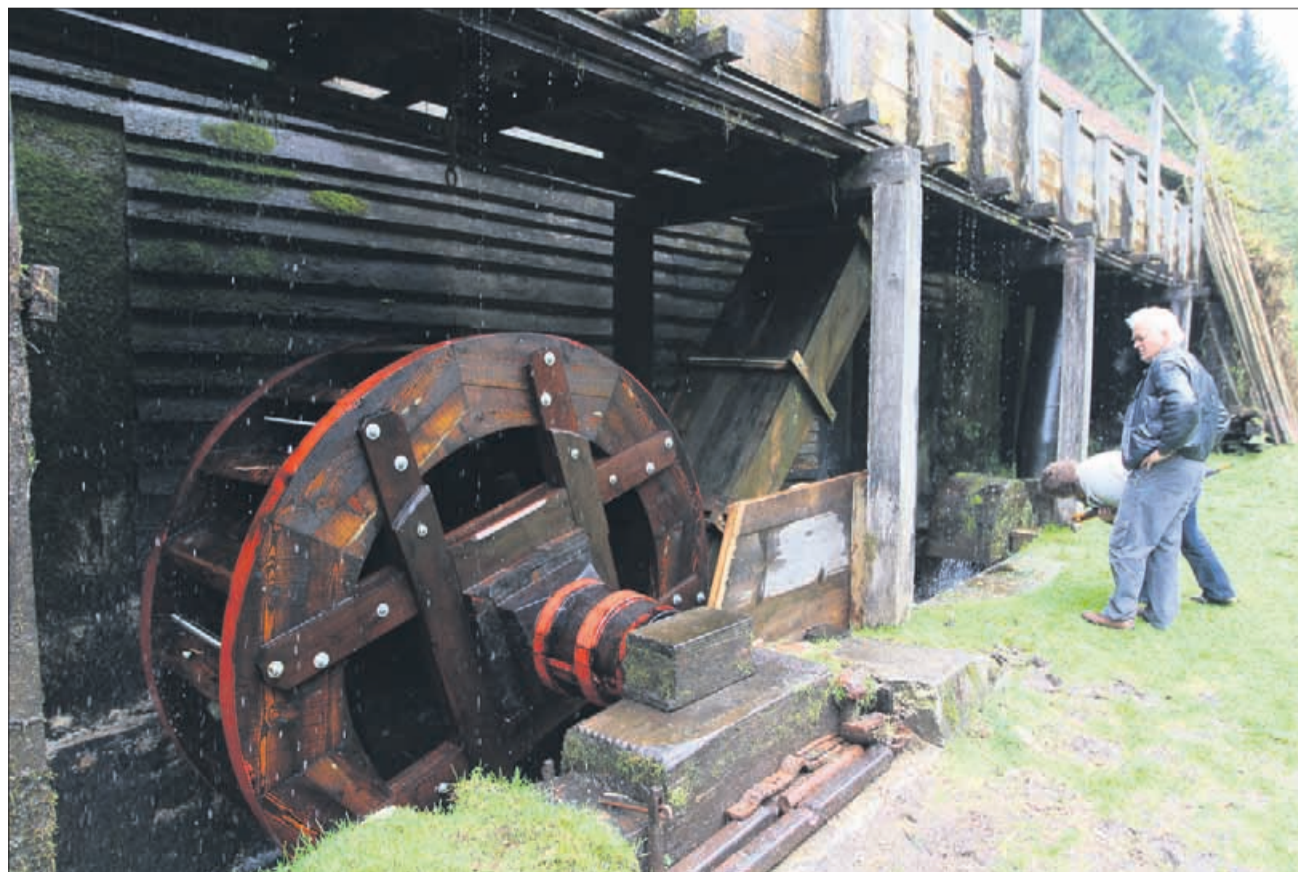
Vodno kolo, ki poganja kovaško kladivo, imenovano repač.