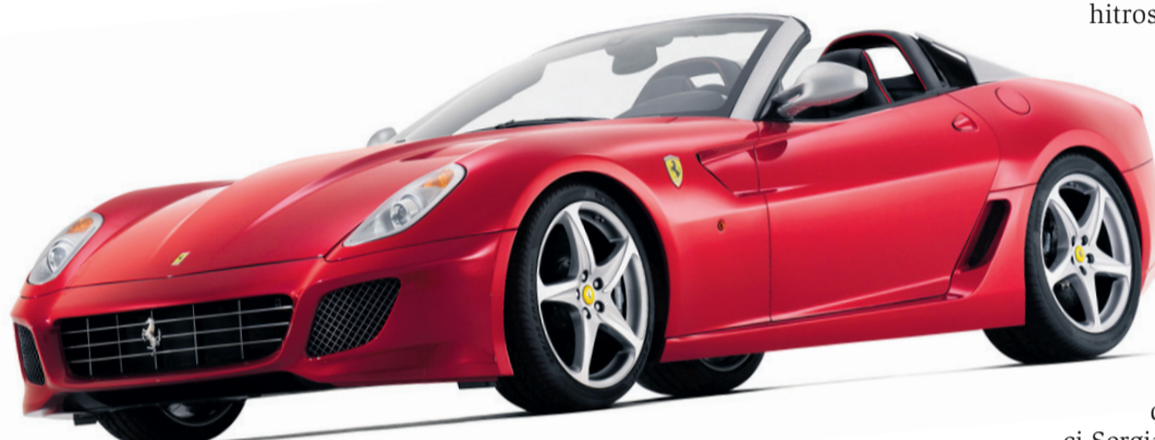
Ferrari SA aperta