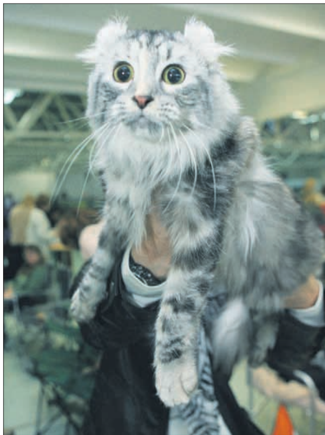
»Od vseh teh bliskavic in kamer bi tudi vi imeli velike oči. Miiijaaav!«