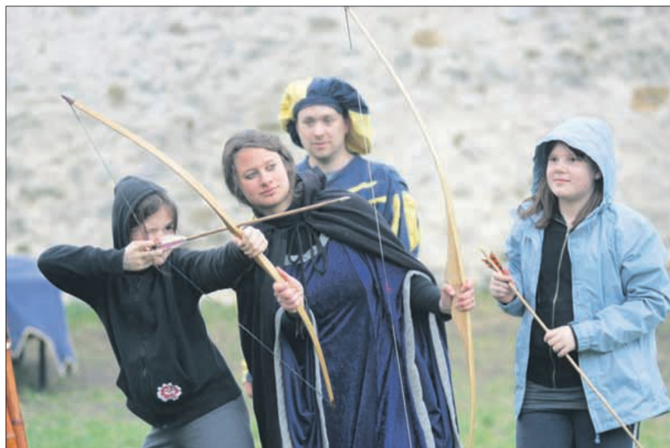
Program Žive zgodovine na celjskem Starem gradu je postal pravi hit letošnjega turističnega leta, pravijo v Zavodu Celeia Celje.