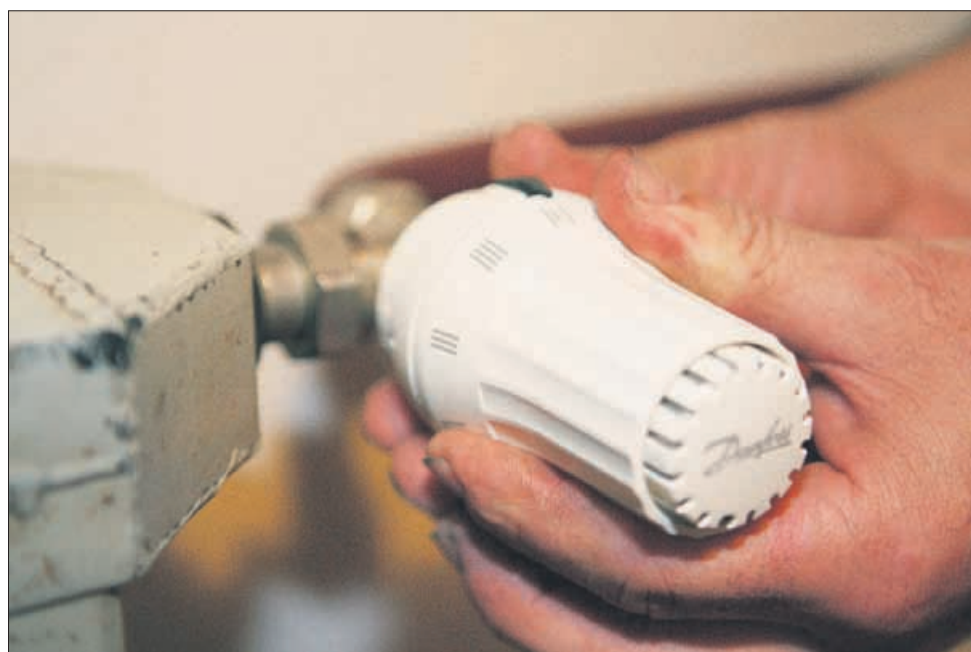
K nižji porabi energije poleg delilnikov, ki merijo porabo toplote, prispevajo tudi termostatski ventili, s katerimi uravnavamo temperaturo v prostoru.

več posameznimi deli, ki bo začel veljati s 1. oktobrom 2011, do takrat pa se bo uporabljal pravilnik iz leta 2005. V novem pravilniku je tudi določeno, kako se obračunajo stroški za lastnike, ki ne namestijo delilnikov. Zanje pravilnik predvideva plačilo ogrevanja glede na ogrevano površino, pomnoženo s faktorjem 1,6.