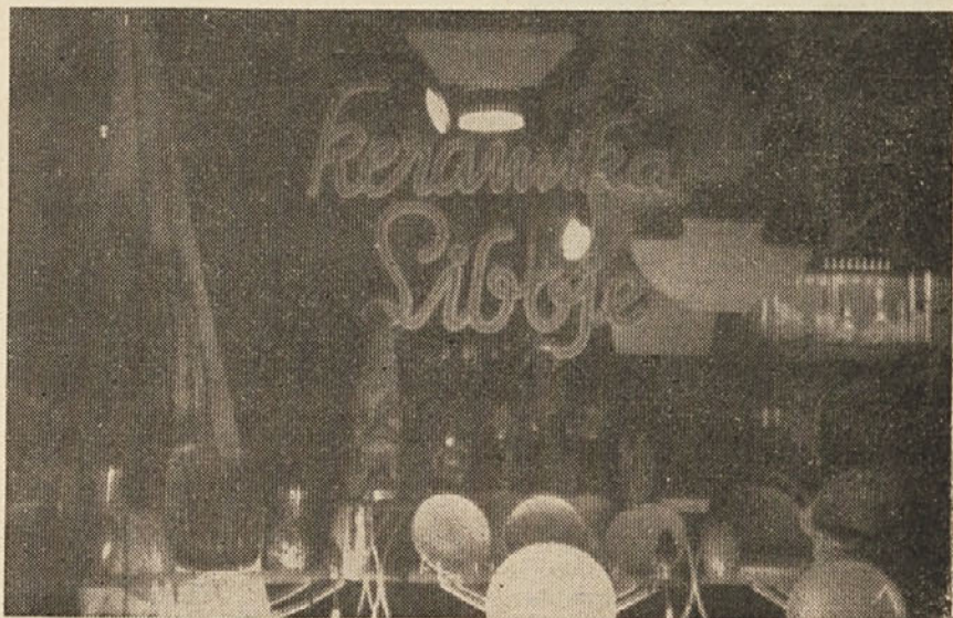
V resnici je lepše