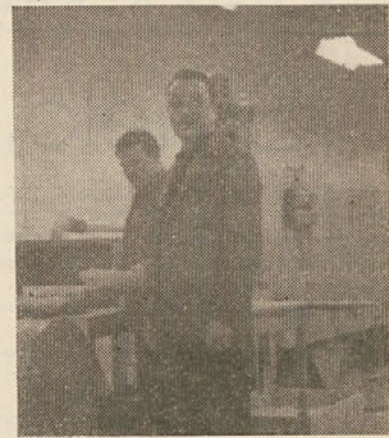
Preizkušnja je uspela