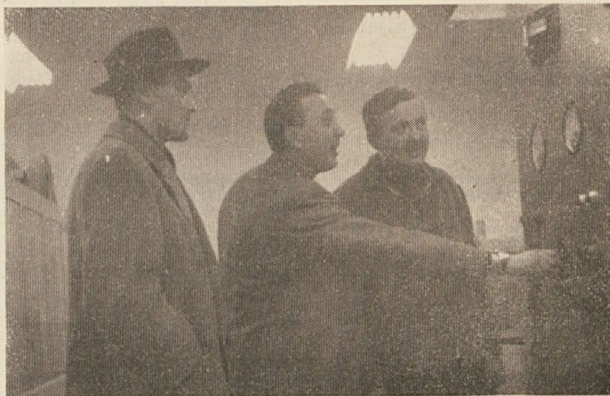
Monter je pognal v pogon novo deko orno peč.

Da bi se pospešilo delo v zvezi z izdelavo omenjene dokumentacije je občinski LO poslal vsem gospodarskim organizacijam pismo v katerem prosijo, da gornje posredujejo članom kolektiva, z namenom, da posamezniki oz. interesenti, ki želijo graditi na območju občine Zalec, bodisi v sklopu večje stanovanjske hiše oz. žele stanovanje, izpolnijo obrazec, ki je bil okrožnici priložen in ga po-