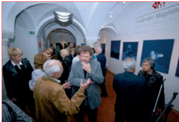
Z otvoritve razstave v Mestni hiši.