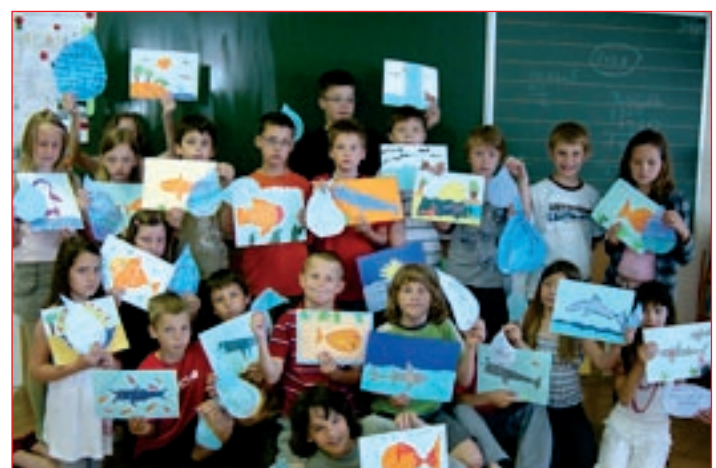
Učenci 4. b s svojimi vodnimi motivi

Raziskovali smo, na kakšne načine je voda uporabna za življenje, in prišli do zaključka, da je glavni vir življenja za vsa živa bitja. Vsak učenec si je izdelal opomnik, kako bo varčeval z vodo, kaj lahko kot posameznik naredi za čistejšo okolje in kaj kot član neke skupnosti. S Panorame in Ptujskega gradu smo opazovali reko Dravo in njen tok ter spoznali, da je naše mesto Ptuj poseljeno na obeh bregovih reke. Na ekskurziji smo si ogledali mlin na Muri in se s