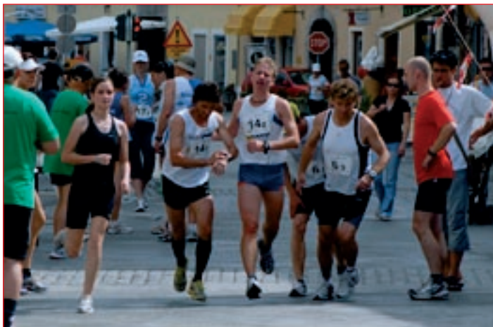
Na startu teka partnerskih mest se je zbralo 76 tekmovalcev.

go teka in gostitelji. Najprej so vsi izrazili navdušenje, pomešano s pozitivnim presenečenjem, nad kakovostjo hotelov Mitra in Park ter toplim sprejemom. Vse dni bivanja na Ptujju so jih spremljala vina Ptujjske kleti. Tudi ogled arheoloških zbirk v dominikanskem samostanu je