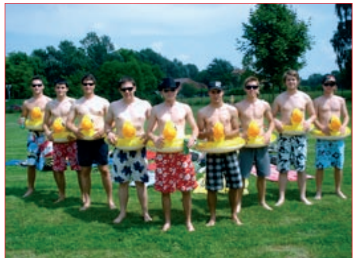
Največja zabava ob bazenih v Sloveniji je tudi letos privabila veliko mladih, ki so se pomerili v številnih šaljivih igrah.

Ob deseti obletnici Baznih energij so se organizatorji vrnili k elektronski glasbi, saj se je projekt tako tudi začel. Nastopili