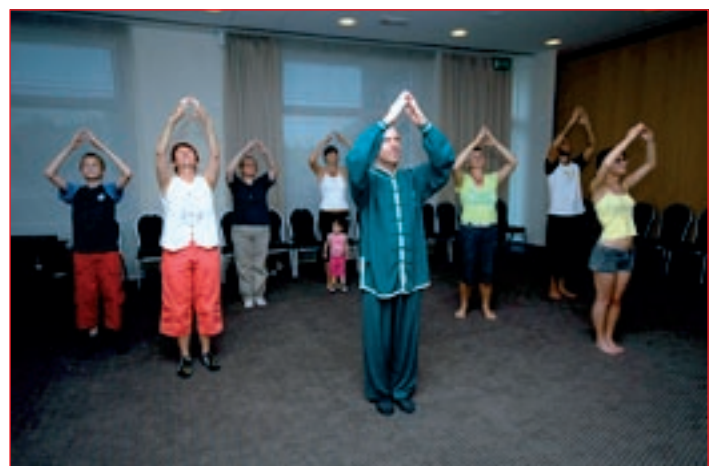
Sporočilo Festivala zdravja je: Zdravi ljudje v zdravi naravi. Na fotografiji udeleženci delavnice tai chia.