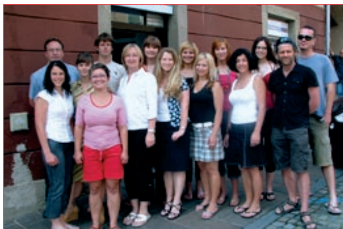
Ekipa KKS Ptuj in ptujске lokalne televizije PeTV pred novimi prostori na Slovenskem trgu 1.

S prehodom na samostojni kanal so se pokazale potrebe po novih vsebinah, ki jih s skopo opremo skrbno načrtujejo. Ob Ptujski kroniki, ki je na sporedu ob torkih in petkih ob 18. in 20. uri,