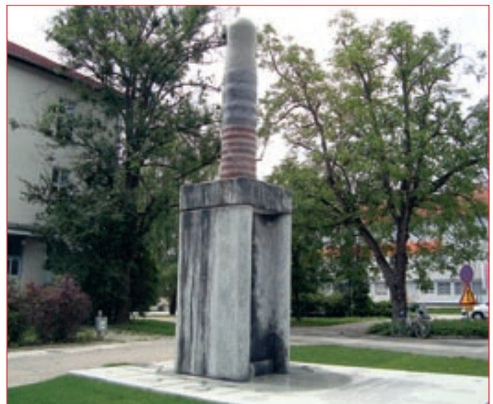
Na Vičavi, na dvorišču nekdanje vojašnice je postavljen spomenik vsem borcem in žrtvam za svobodno Slovenijo.