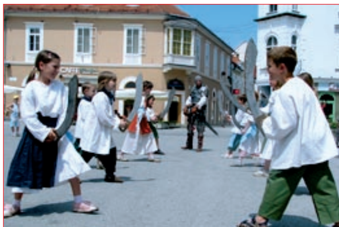
Pridobljene večšine so otroci prikazali na Mestnem trgu.