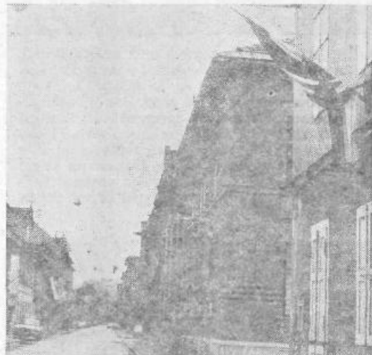
Zbledele, ovite okrog drogov...