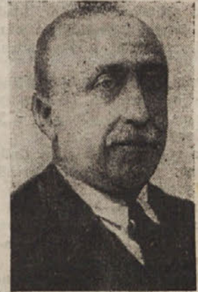
Alcalá Zamora predsednik španske republike, ki ga je parlament odstavil (Glej poročilo na str. 7.)

Moskva, 8. aprila. (Tass). Danes je objavljen tekst protokola o medsebojni pomoči, ki je bil zaključen 15. marca med Sovjetsko Rusijo in Zunanjo Mongolijo. V glavnem določa ta protokol, da si obe državi priskočita ena drugi na pomoč, ako sta napadeni od kakšne druge države. S tem protokolom so se tudi utrdili medsebojni prijateljski odnošaji.