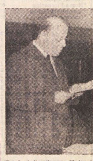
Predsednik Angel Kukanja