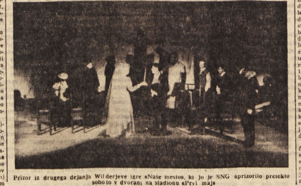
Prizor iz drugega dejanja Wilderjeve igre «Nase mesto, ki jo je SNG uprizorilo preteklo soboto v dvorani na stadionu «Prvi maj»