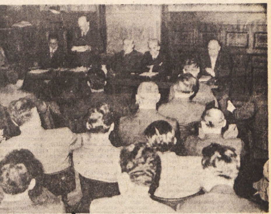
Pogled na dvorano ob II. zasedanju glavnega sveta SGKZ