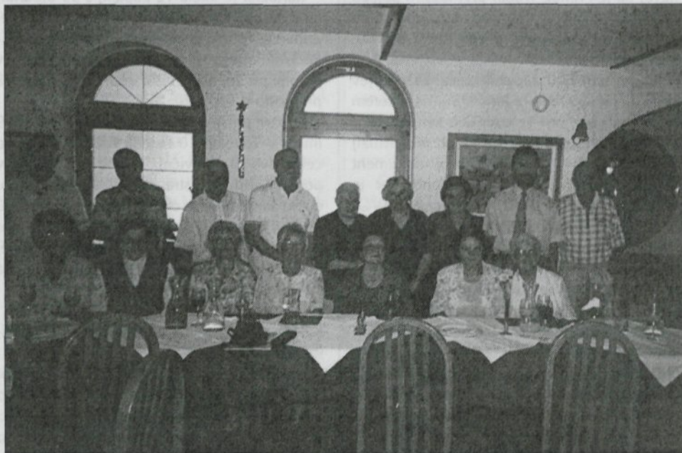
Menceški izgnanci na srečanju ob 60-letnici izгона iz domovine.