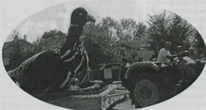
Še eden od mnogih vozov.

Ta gostovanja so godbenikom postala prava rutina in nas nič ne more presenetiti. Tudi celodnevna in nočna vožnja v avtobusu ne. Ker v kraju Oradour nimajo ustreznih prenočitvenih zmogljivosti (podobno kot v Mengšu), smo spali v 50 km oddaljenem Limogesu. Vedno je bolje, če so nastopajoči nastanjeni v samem mestu festivala. No nekaj pravega festivalskega vzdušja pa smo le imeli oz. smo tudi sami nekaj prispevali. Bil je en sam zabavišni park. Veliko se nas je pošteno prestrašilo in prebledelo ob vožnjah na raznih vrtljakih. Neverjetno, kakšno »fešto« priredi kraj s 1500 prebivalci. Kulturna razlika med našimi in tistimi kraji pa je zelo opazna. Tam se ljudje precej manj sekirajo, so bolj odprti, niso tako malenkostni. Imam občutek, da so prej z vsem zadovoljni. Mengeški godbeniki imamo dobro »navezo« v Franciji, ki jo lahko samo še utrdimo in se dogovorimo še za kakšno zanimivo gostovanje v zadovoljstvo in spodbudo predvsem mlajšim godbenikom. No pa tudi na stare mačke je potrebno gledati. Letošnje gostovanje v Franciji je bilo še posebno zanimivo, ker smo šli na to