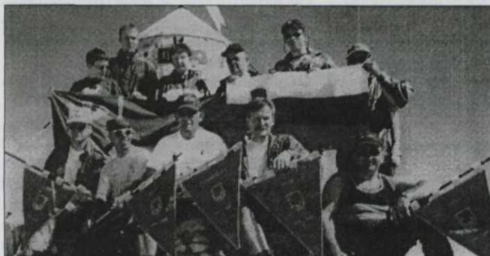
Triglav, 13. julij 2001