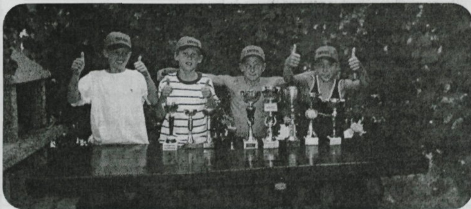
Mladi menceški skakalci z velikim uspehom zastopali naš klub na mednarodnih tekmah v Avstriji.

Celovec, 25. in 26. avgust 2001. Na Avstrijskem Koroškem je bilo ta dva dneva veliko mednarodno tekmovanje v smučarskih skokih in kombinaciji. Merili so se na plastični podlagi, udeležili pa so se ga tekmovalci iz Avstrije, Italije in Slovenije. Zraven so bili tudi naši najmlajši menceški orličji.