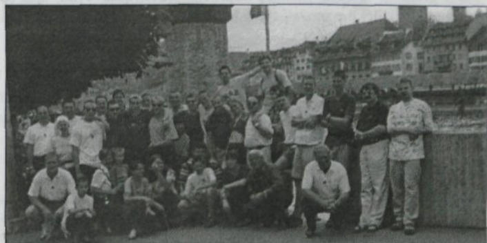
V Luzernu z značilnim lesenim mostom v ozadju.