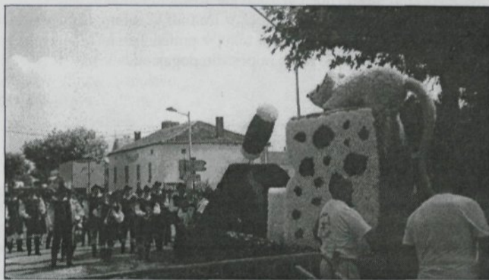
Cvetlični aranžma z godbo v ozadju v Franciji.

Že kar nekaj let se godbeniki udeležujemo raznih festivalov v Franciji in Španiji. Tokrat smo zadnji vikend v juliju sodelovali na cvetličnem festivalu v mestu Oradour v bližini Limogesa v Franciji. Značilnost vseh teh festivalov je, da v povorkah sodelujejo veliki cvetlični aranžmaji na vozovih, izdelanih iz papirja. Res lepo. Od daleč izgleda kot pravo cvetje! Med temi kompozicijami pa nastopajo razne glasbene in ostale show skupine iz različnih držav.