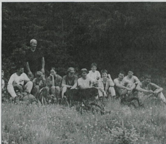
Samo še pol ure, pa bomo na vrhu Virnikovega Grintovca.

VESELIMO SE ŽE TABORA NASLEDNJE POLETJE, KO BOŠ Z NAMI TUDI TI!