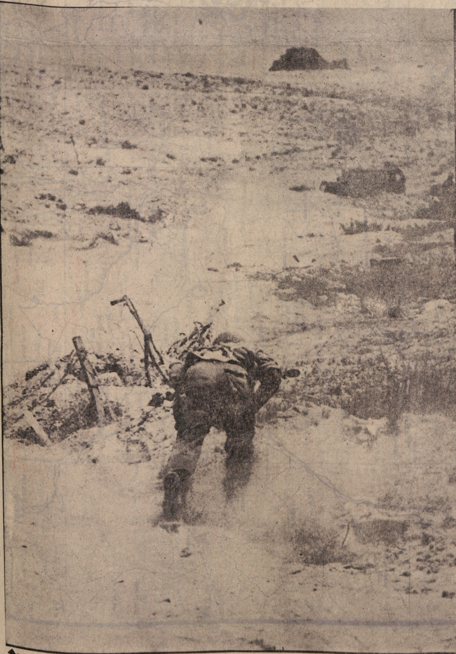
Izraelska patrolja v spopadu v puščavi Negev. Na tem področju so se spopadli s velikim številom tankov.

TEDESKA TRIBUNA POSEBNA IZDAJA Ljubljana, 8. junija 1967 Cena 80 par (80 starih dinarjev)