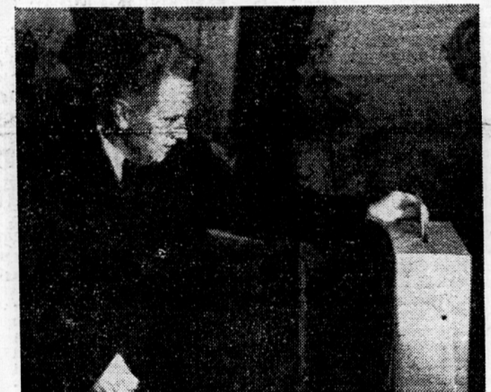
Predsednik vlade LRS tovariš Miha Marinko voli

Ljudstvo Kopršćine in Bujšćine je ponovno izreklo svojo voljo. Do 12. ure je v obeh okrajih volilo okoli 90% vseh volilnih upravičencev.