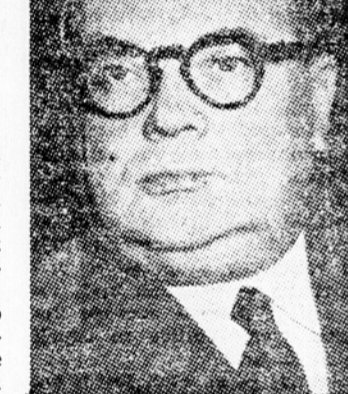
Paul H. Spaak

Pisal je tudi o stališču jugoslovanskih komunistov do zahoda in do naprednih gi-