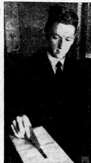
Mladinec izpolnjuje prvič v življenju svojo državljsko dolžnost na volišču.