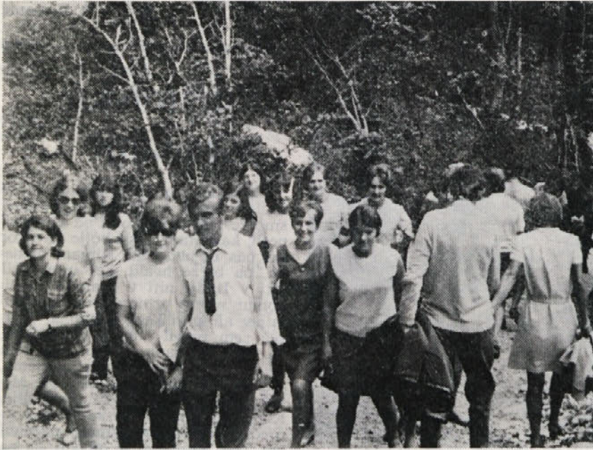
Postanek z izleta. Po dolgotrajni avtobusni vožnji je bil sprehod po Logarski dolini nadvse prijeten

V Metliki se je pred kratkim začel tečaj za šoferje amaterje, ki ga je organiziralo Avto moto društvo. Tečaj obiskuje 35 tečajnikov. Vpisnina v tečaj znaša 110 novih din.