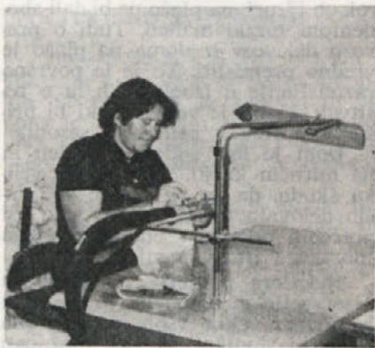
Delavka na stroju za čiščenje sukanca v obratu Dobova

Predstavljamo vam tri sodelavce na delovnem mestu: