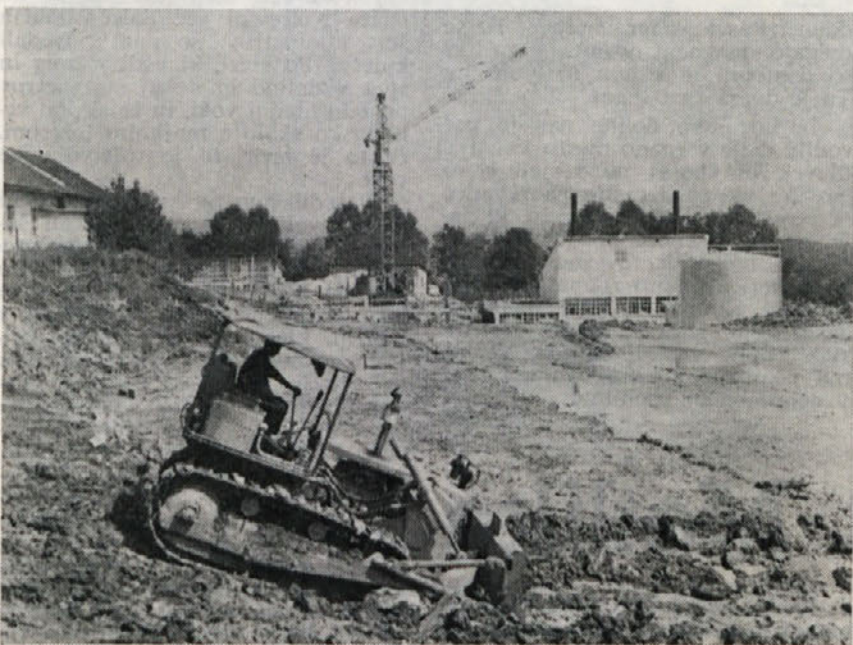
Zemeljska dela za gradnjo novega objekta s pletilnico so se začela. Buldožerji neutrudno odstranjujejo zemljo in pripravljajo teren za gradnjo