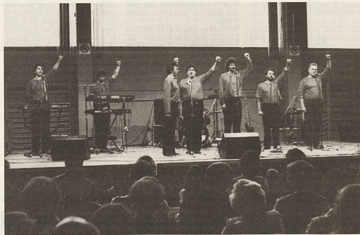
■ Zadruga Ars Nova je 13. 5. organizirala v Športno-kulturnem centru v Zgoniku prireditev »Humoristi vseh dežel, združite se«.