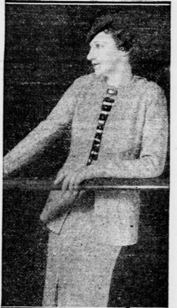
Po vročih aprilskih dneh so se požurili pariški modni saloni s kostumi za popoldnansko rabo. Pod jopico nosi ta dama takozvani bajaderski pulover