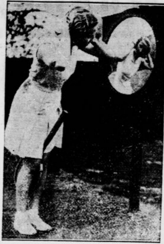
Ta mlada teniška igralka ima lepoto za prvi pogoj uspešne igre na tenišču