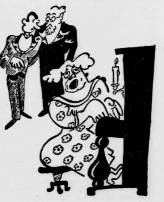
Klavirski večer »Pravkar je prišla s konzervatorija.« »Kako menite to: ali ga je dovršila ali so jo vrgli ven?«