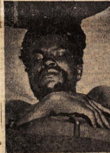
Dedan Kimathi, eden izmed voditeljev upornikov Mau-Mau v Keniji, ki so ga Britanci te dni v boju ranili in ujeti ter vklenjenega prepeljali v bolnišnico v Nijeriju v Keniji

Zdrnil se je šele v ruskem okraju v vzhodnem Berlinu. Okrog njega so bili zbrani Rusi, Kmalu se je preprašil, da je pasivni odpor brez pomena. Obdvoval je skupaj z nekim ruskim generalom v civilu. Na sestanku z novinarji pa je govoril tako, kakor so ga bili pripravili. Bil je v Moskvi, pozneje pa štiri mesece v nekem okrevališču ob Črnem morju. Kakal je na trenutke, da bi pohegnil, in ga tudi dočakal... Na vprašanje predavdnika sodišča, zakaj v poldrugem letu na mnogih srečanjih z novinarji z Zahoda ni namigall zahodnonemskim oblastem na svoje namene, je John odgovoril: »Tudaj bi Rusi občrnatli z menoj.«