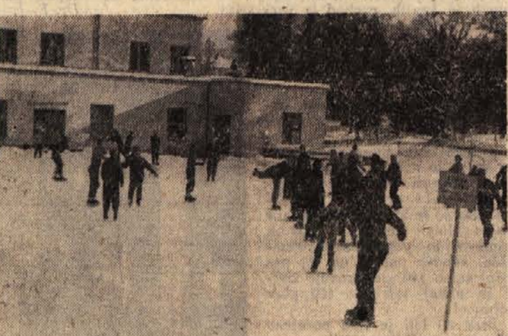
Blejska mladina se zelo navdušuje za drsanje

Takšno je torej športno življenje v Bledu: pestrost, aktivnost, vzorna disciplina in red, kar mora slej ko prej roditi sadove. S. I.