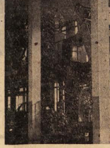
Pogled v glavno obratno dvorano Tovarne za predelavo sočivja v Tetovem. Delo poteka po tekočem traku