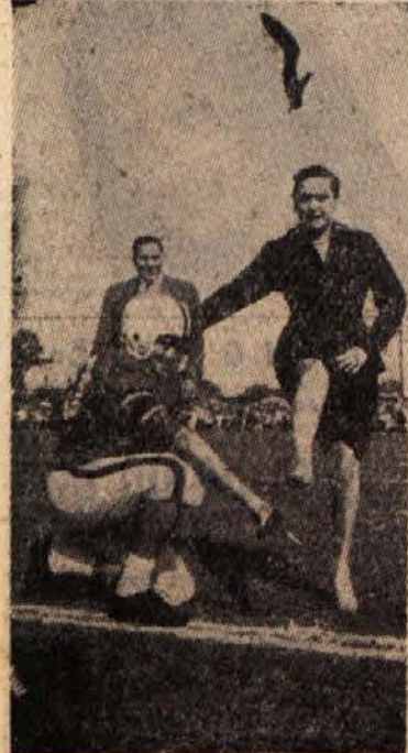
Za popularizacijo ameriškega rugbyja so povabili na začetni udarec v Otiavi znano filmsko sestro Dorothy Lamour, ki je za reklamo nosila čevlji iz nove plastične snovi. Podolga sta žoga so je takotallila nekaj metrov daleč, igralci pa je čevlji snuknil z noge in ji zletel visoko nad glavo, kot kaže slika. Igralka si je baje zlomila lakirani nohti na palcu. — No, reklama je dosegla svoje: Judje so tisto popoldne govorili o igralci, o njenih čevljih in o laku na nohte...

»Ob priložnosti vašega godu izražamo dragemu direktorju najprirčneje čestitke. Med poslušalci je bilo slišati šum iskrenega občudovanja, priznanja, spoštovanja, po malem pa tudi zavisti.