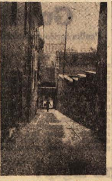
Ulica v starem delu mesta Maribora

Co nimamo nobene industrije, bi lahko ustanovili vsaj gradbeno podjetje; strokovniki in pomožni delavci imamo pri nas dovolj. Tako so menili ljudje v cankovski občini. Občinski ljudski odbor je uresničil njihovo željo in letos ustanovil gradbeno podjetje »Temelj«. Čeprav je podjetje še mlado, ima mnogo dela, saj si ga je poiskal skoraj po vsem Gorickem, torej tudi preko meje svoje občine. Sedva ni po brez začasnih težav in slabosti, ki pa jih odpravljajo.