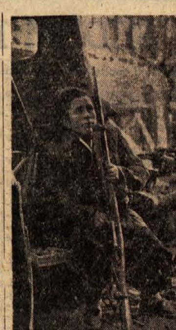
Za barikado — trenutek počitka

Vračam se proti hotelu in razmišljam. Zdaj sem sam, ker se je moj vodnik vrnil domov. Noč je. Ura je šest. Čeprav upam, da je najhušje minilo, nisem prepričan, da bo že od nočjo prepovedano streljati brez opozorila na vse, ki se znajdejo po šestih na ulicah. Teči ne morem, prekleti novi čevlji, ti vražji koničasti čevlji, ki nikaner ne ustrezajo peščem z visokimi členki.