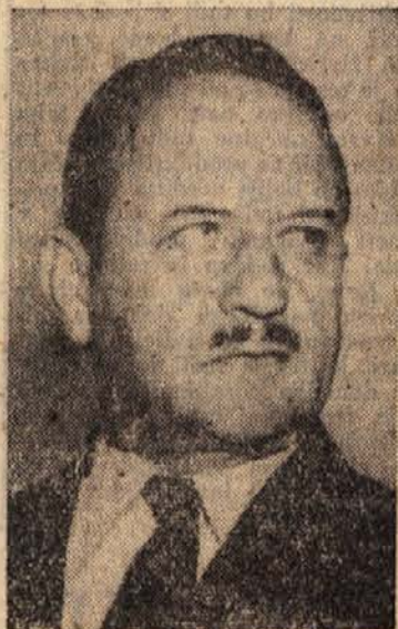
Generalmajor E. L. Burns

Nagli sporazum o vlogi, sestavi in razmestitvi varnostnih