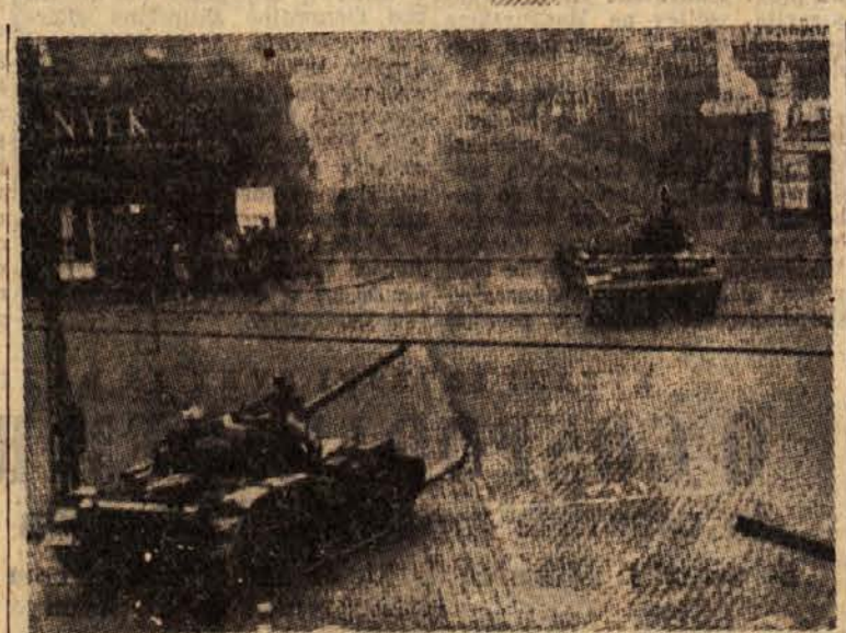
Tanki v bojnih na budimpeštanskih ulicah

»Ne bi mogli reči, da ne nastopajo sovjetske čete te dni korektno, kjer le morejo. Streljajo samo, kadar kdo strelja nanje. Kadar pa se pomikajo proti njim sprevodi demonstrantov, streljajo čeznje. Ko ne bi ravnali tako, bi