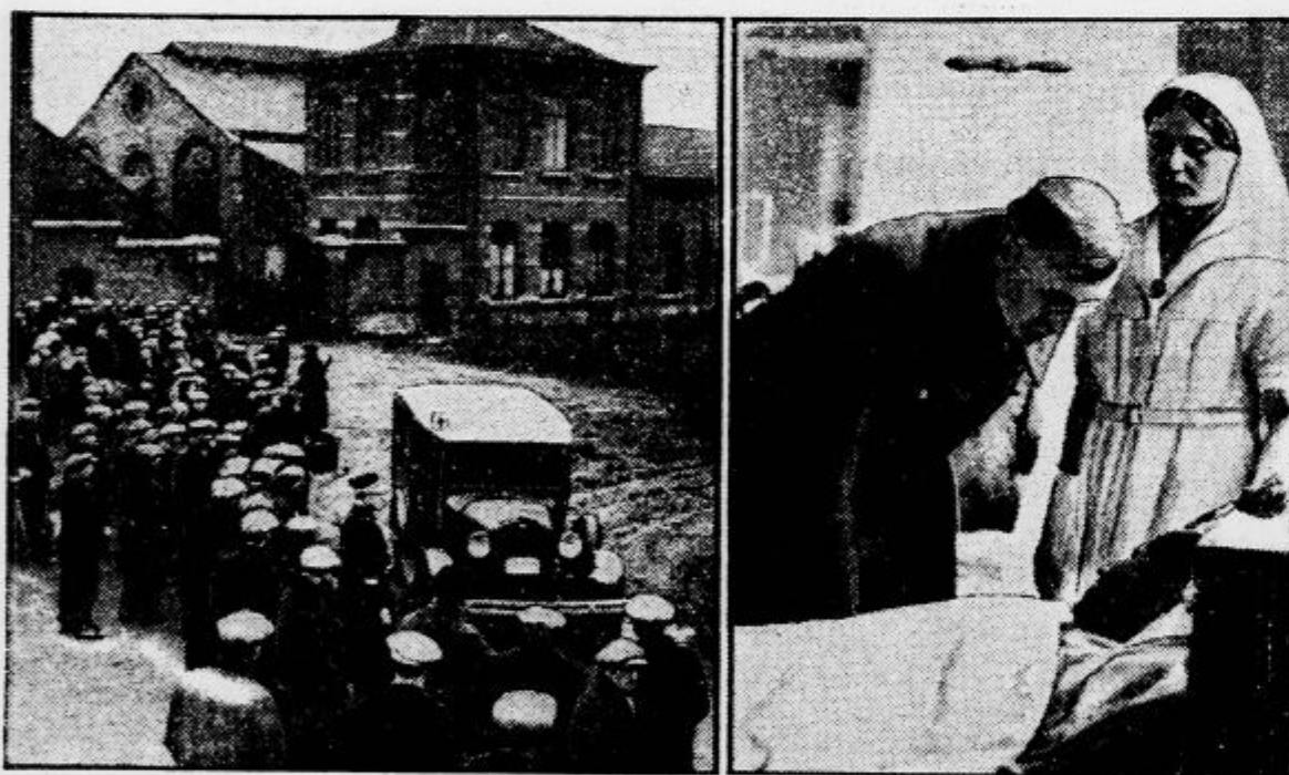
Pri katastrofi v Marchienneu (pri Charleroiu) se je posrečilo rešiti 8 rudarjev, 17 rudarjev pa je našlo smrt v globini 1250 m. Levo: prevoz ranjenih rudarjev. Desno: belgijski kralj Albert na obisku pri rešenih v bolnici