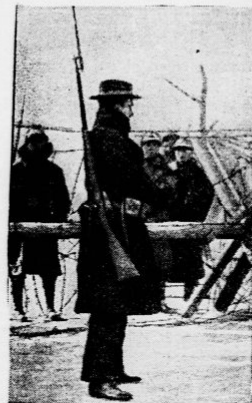
Mednarodno koncesijo v Sanghaju stražijo tudi oboroženi civilni Evroptci