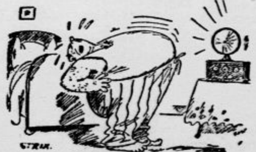
Telovadba po radu »In potem prsa ven, kolikor morete! — Še bolj!«