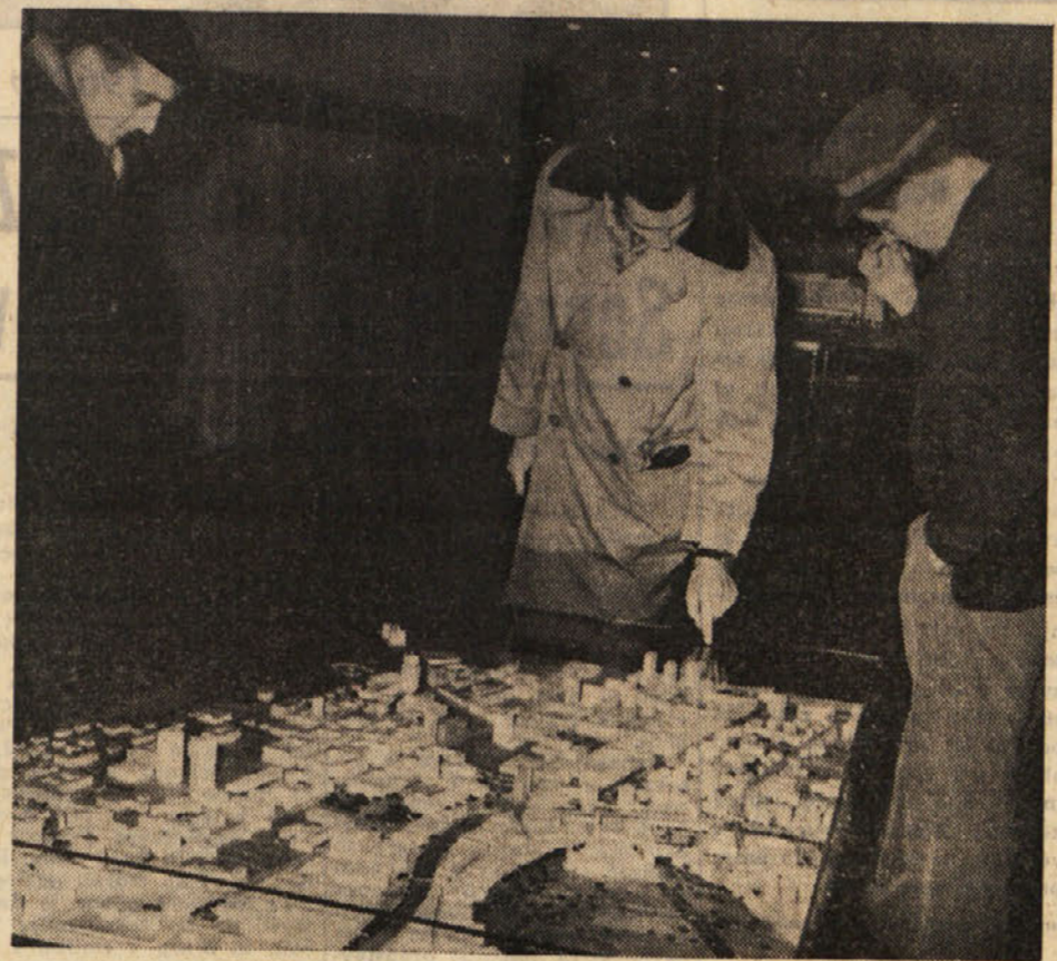
Na razstavi urbanističnega razvoja Ljubljane si ljudje z zanimanjem ogledujejo na plašničnih prikazih, kako se bo v bodoče razvijalo glavno mesto Slovenije