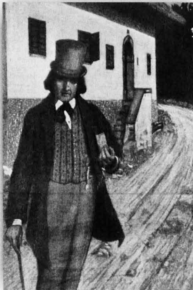
NASA SANTEL 1905 / O VRBA