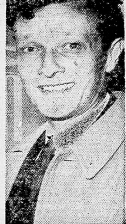
Jean Louis Barrault je naš nepoznani znanec iz velikega filma »Otroci paradiza«.

Nedavno sem čital v časopisih da so filmski delavci v Zagrebu skušali in želeli svojo poklicno organizacijo uporabiti poleg drugega tudi za šolanje filmskih kadrov. Mislim, so predvsem na tiste, ki v filmu že delajo, a za katere vemo, da nimajo vseh tistih kvalifikacij in tistih razgledov, ki