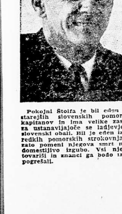
Pokojni Stolfa je bil eden najstarejših slovenskih pomorskih kapitanov in ima velike zasluge za ustanavljanje se ladjevle ob slovenski obali. Bil je eden izmed redkih pomorskih strokovnjakov, zato pomeni njegova smrt nenadomestljivo izgubo. Vsi njegovi tovariši in znanci ga bodo trajno pogrešali.

Socialistični zveza v Mengšu je dokaj delavna. Sekretariat občinskega odbora skrbno sestavlja program za daljšo obdobje in o njem razpravlja na svojih sejah, zatem je pa še na dnevnih redih se občinskega odbora SZDL, ki jih redno sklicujejo vsak mesec. Ker se, kolikor je je mogoče, držijo sprejetega programa tudi dosega uspeha. Le tako je lahko Socialistična zveza najbolj delovna organizacija v občini, saj sodeluje domala povsod, kjer je njena pomoč potrebna. SZDL uspešno skrbi za vsestransko dejavnost v občini ter sklicuje razne sestanke in posvetovanja. Najbolj uspešna sta bila v zadnjem času predvsem sestanka s prosvetnimi delavci in s predstavniki tovarn. Na sestanku s prosvetnimi delavci so razpravljali predvsem o nabavi najnujnejših učil za šole, vključevanju mladine v razna društva, knjižnicah, sodelovanju prosvetnih delavcev pri kulturno-prosvetnih delavnosti in drugem. Občinski odbor SZDL je sodeloval tudi pri pripravah na občne zbere sindikalnih podružnic in se jih udeleževal po svojih zastopnikih. Omenimo naj še ideološko komisijo, ki že 4 leta dokaj uspešno deluje in skrbi poleg drugega tudi za iz-