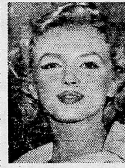
Ameriška filmska zvezda Marylin Monroe je sklenila postati velika igralka in vse kaže, da ji je to tudi uspelo.

je režiserske sposobnosti prav ob legendarnem holandskem ljudskem junaku Tillu Eulenspieglu, ki ga je tako mojstrsko opisal belgijski romansopisec Charles de Coster. Sam si je poiskal producente, ki so bili pripravljeni dati na razpolago materialna sredstva za realizacijo te zamisli. Ko je našel producente, je tudi odločil, naj prevzame umetniško vodstvo največji holandski dokumentarist Joris Ivens.