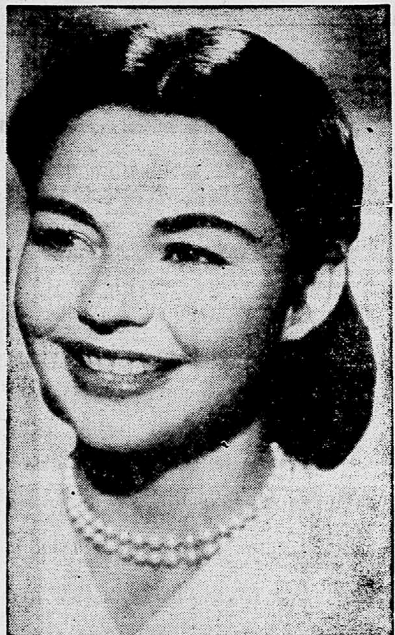
Jennifer Jones je ena izmed najbolj poznanih in najboljših ameriških karakternih filmskih igralk.

JAMES DEAN je takorekoč idol sodobnih ljubiteljev filma v ZDA. Znano je, da se je nadarjeni igralec ponesrečil z avtomobilom ob koncu snemanja svojega tretjega filma. Zda so sporočili, da bo v kratkem izšla knjiga režiserja Nicka Raya, Jamesovega dobrega prijatelja, v kateri bo opisal življenje mladega, ki se je tako naplo povzpel med prve v ameriškem filmu.