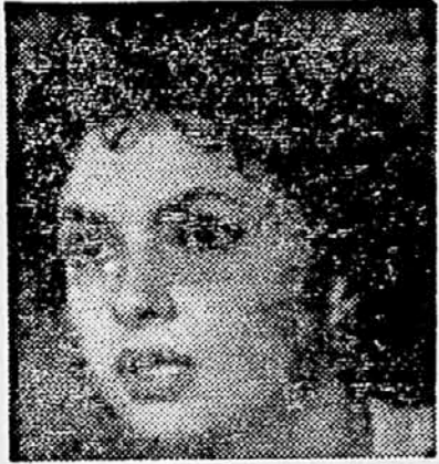
Od vseh filmskih eminec neznega spola nam je najbolj simpatična italijanska igralka Gina Lollobrigida. Ki nas je v zadnjih dneh nad vse prijetno presenetila kot izvrstna igralka v filmih »Kruh, ljubezen in fantazija« ter »Kruh, ljubezen in ljubosumnost«.

Prihodnje leto januarja bo v Ljubljani kongres združenja filmskih delavcev Jugoslavije. Mislim, da je pred tem kongresom treba v zvezi s kadri naših filmskih delavcev iznesti nekaj problemov, ki so v sedanjih filmskih situaciji pri nas izredno aktualni, pa so po svojem pomenu in obsegu takšni, da ne morejo zanimati samo ozkega kroga filmskih ljudi, temveč široko javnost. Prepričan sem, da se bo kongres filmskih delavcev sam tudi spoprijel s temi vprašanji in da mu bo širša debata o njih samo koristila.