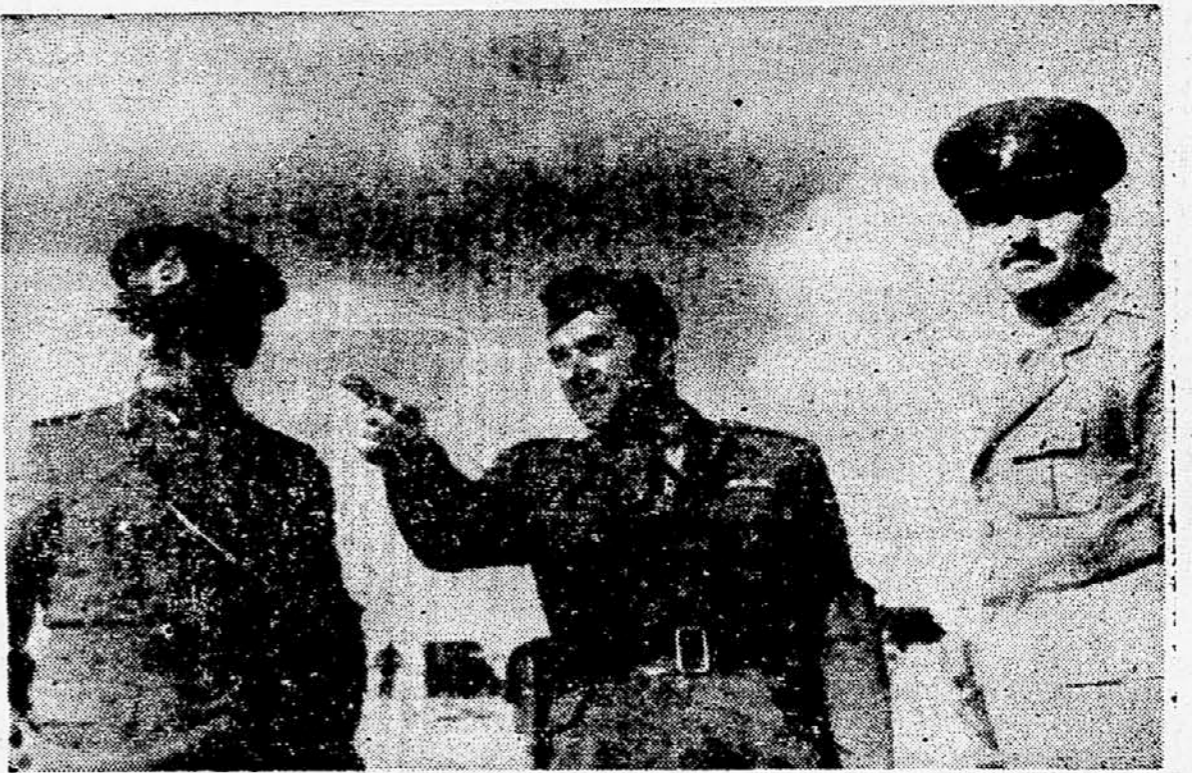
Polkovnik Radovan Vojvodić razkazuje generalu Burnsu, poveljniku sil OZN v Egiptu, položaje na Sinaju.

Na skokovni konferenci v Ottawi je Nehru svetoval zahodnim