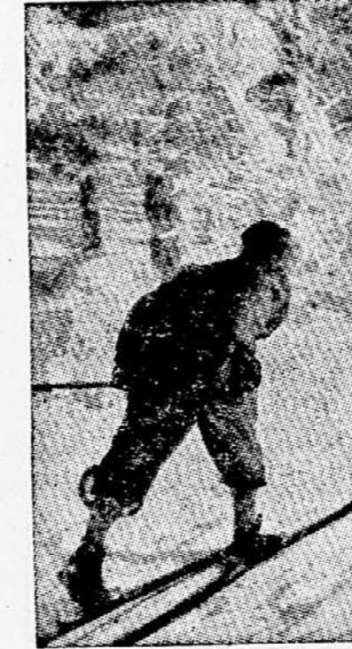
Archiev Mooru sreča ni bila naklonjena. Po 150 nastopih se je moral zadovoljiti s mestom pod prestolom