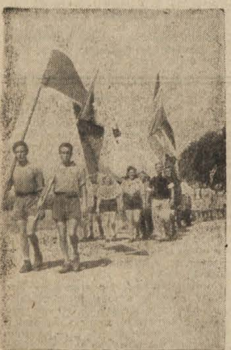
Celjska brigada, ki dela pri regulaciji Pesnice ponosno nosi prehodno zastavico v svoje taborišče.