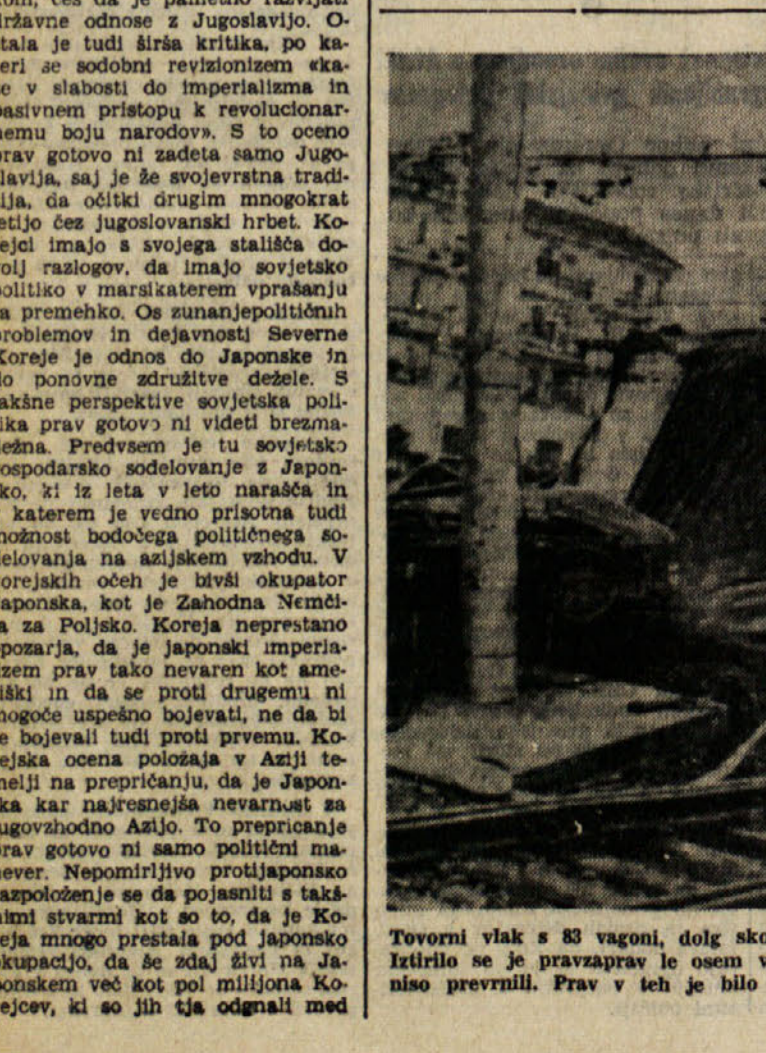
Tovorni vlak s 83 vagoni, dolg skoraj kilometer, se je iztril, ko je ponoči zavozil na postajo Fossano. Iztrilo se je pravzaprav le osem vagonov vlaka. Nekaj se jih je prevrnilo in uničilo, štirje pa se niso prevrnil. Prav v teh je bilo 15 alpincev s 40 mulami; ostali so vsi nepoškodovani. Tudi osebu vlaka se ni nič zgodilo