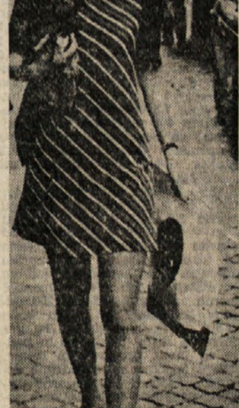
Nordijski po gledu «mini kralj zelo odlično: nobenih vmesnih mer! Na sliki je lepa švedinja Britt Eklund, žena Petra Sellera, na sprehodu po Rimu

Drugi pismo vprašanje mojega povratka le omenja, citiram ga pa v celoti, ker se Kuhar v njem dokazuje še nekaterih drugih zadev v zvezi z našimi španskimi borci, kar bom skušal pojasniti na koncu.