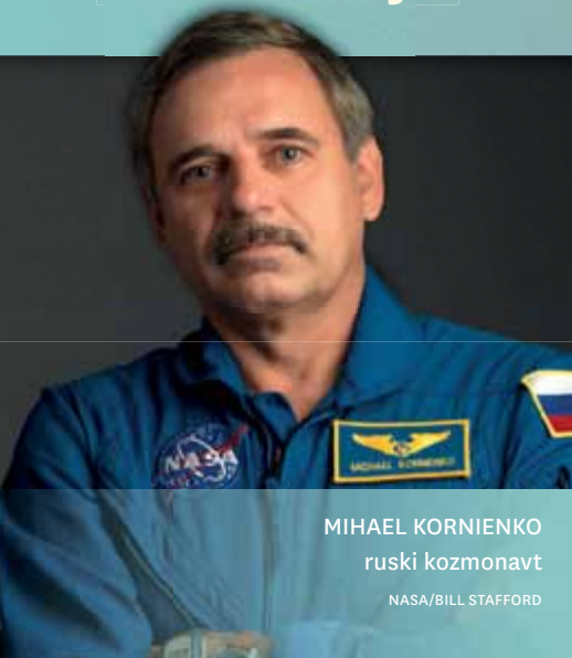
MIHAEL KORNIENKO ruski kozmonavt