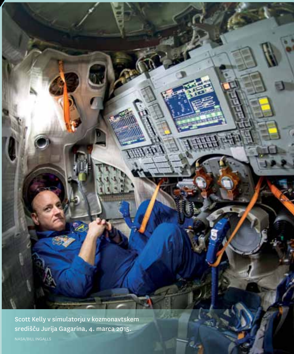
Scott Kelly v simulatorju v kozmonavtskem središču Jurija Gagarina, 4. marca 2015.