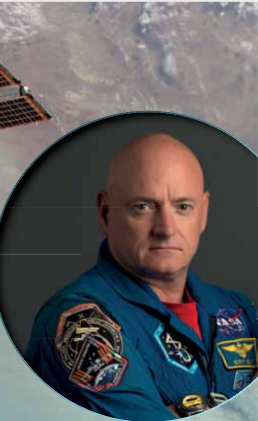
↑ SCOTT KELLY ameriški astronaut