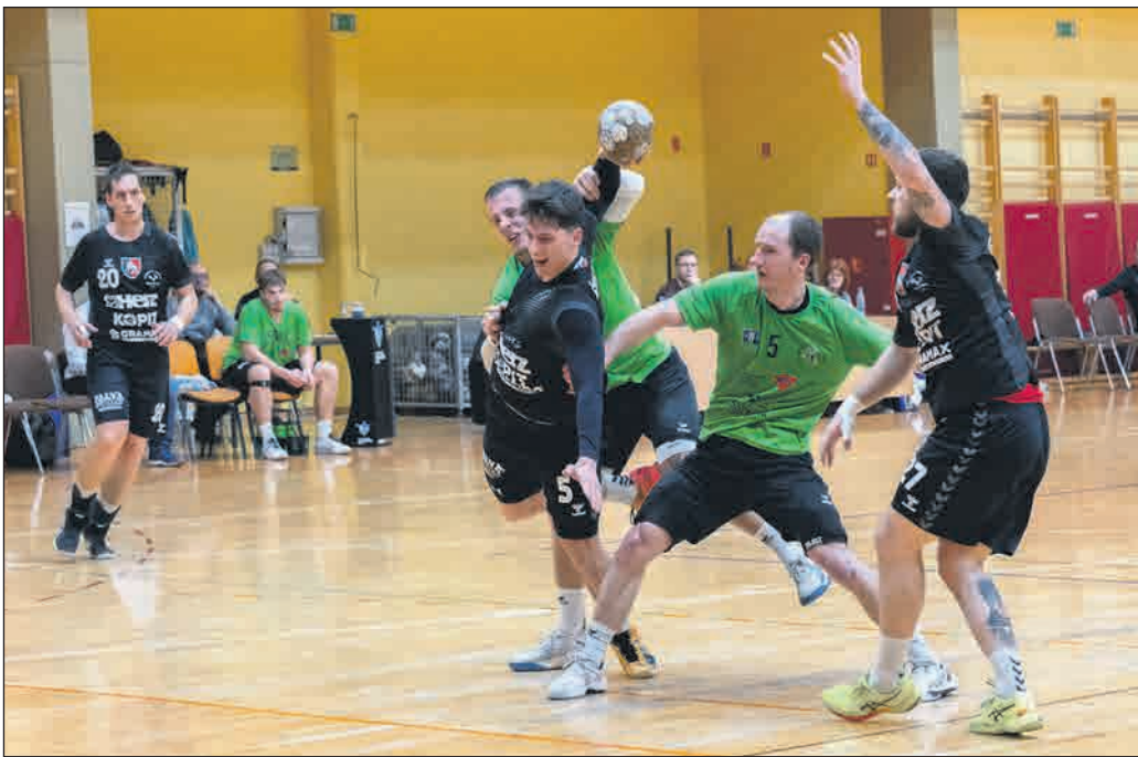
Rokometiški Velike Nedelje so v Šmartnem osvojili dragoceno točko v boju za obstanek.