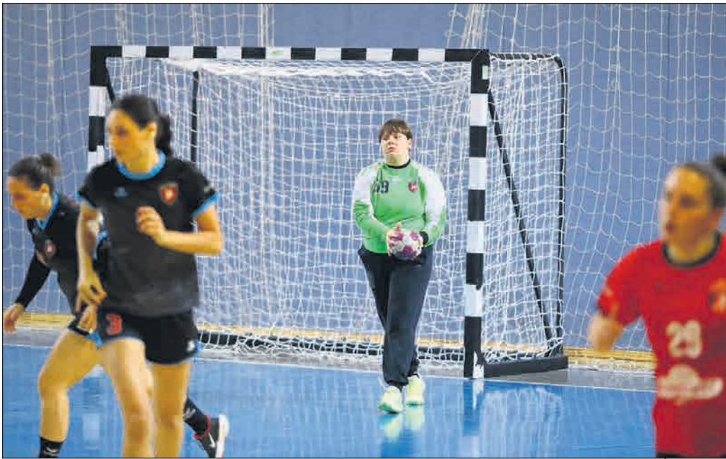
Ajdovke so proti Ptujčankam potrdile vlogo favoritinj.

Ptujška ženska rokometna zasedba je v 11. krogu gostovala v Ajdovščini. Ker so le dve uri prej imeli v isti dvorani na sporedu tekmo rokometiški Drave, sta si ptujski ekipi organizirali skupni prevoz. To je pomenilo dve dodatni uri čakanja za dekleta. Že brez tega so bile do-