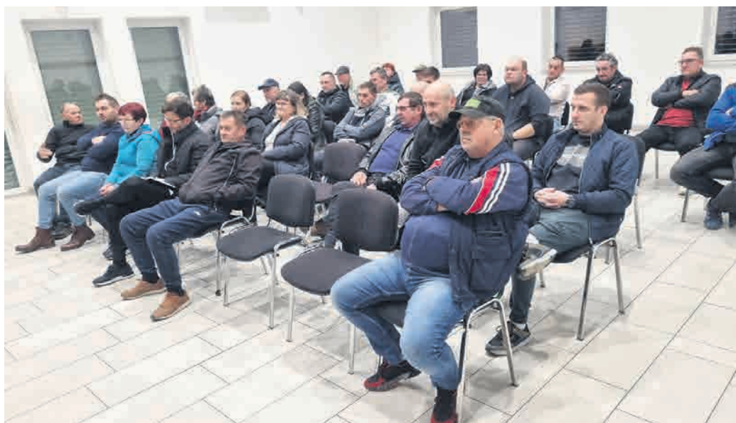
Zbora občanov v Tivolcih se je udeležilo približno 30 vaščanov.

Poleg vaškega doma Tivolci so razpravljali tudi o problematiki cestne infrastrukture. V zadnjem času je sicer občina z lastnim traktorjem že poskrbela za mulčenje jarkov in čiščenje prepustov, v pri-