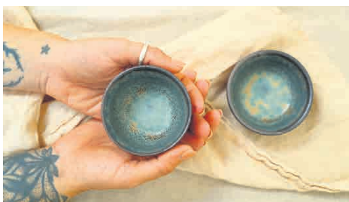
Nina svoj navdih največkrat črpa iz narave, zato se v njenih izdelkih odražajo zemeljski toni in organske oblike.

Ninina dolgoročna želja je, da bi lončarske delavnice postale del več osnovnih šol, saj glina ponuja izjemno izkušnjo – poveže z