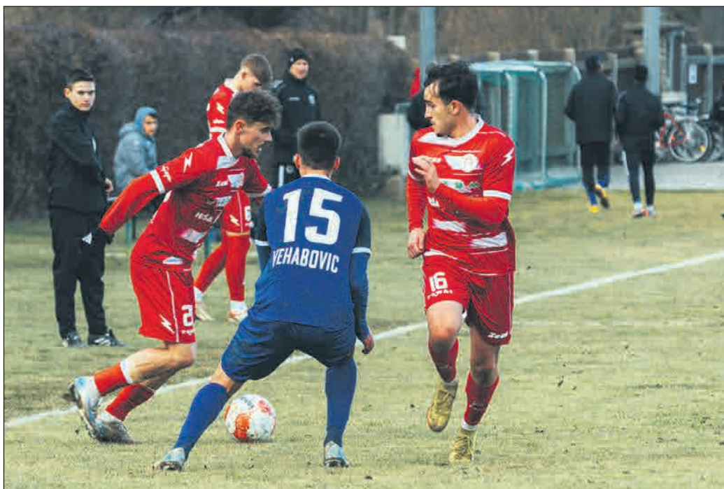
JM Nogometaši Aluminija so izgubili pripravljalo srečanje z avstrijskim drugoligašem.

Četrto pripravljalo srečanje bodo šumarji proti Podvincem odigrali že v sredo, 5. februarja.