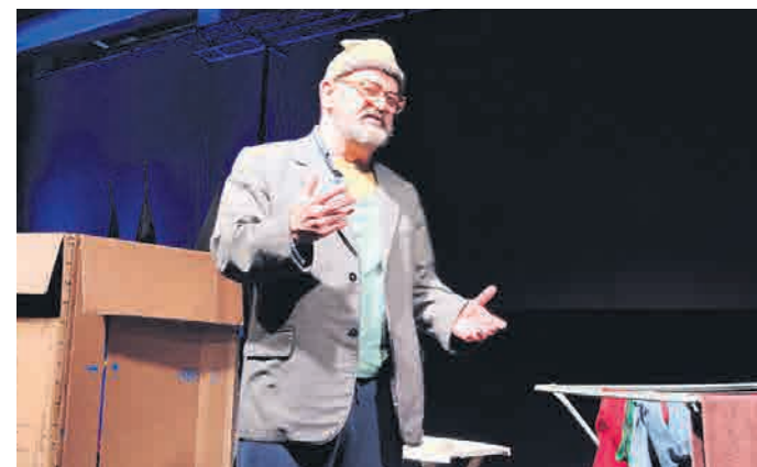
Za obilo smeha številnih udeležencev je poskrbel stand up komik Vlado Novak.