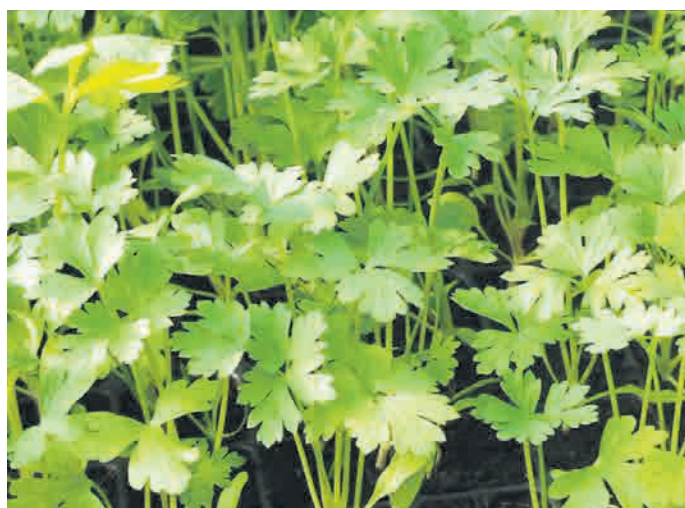
Tudi zeleno, predvsem listnato, že lahko sejemo za sadike.

čebulo, por, predvsem pa tudi grah in bob. Po želji lahko vzgojimo tudi sadike špinacije in motovilca, ki ju bomo sadili zunaj. Zdaj namreč zunanji setev še ni smiselna.