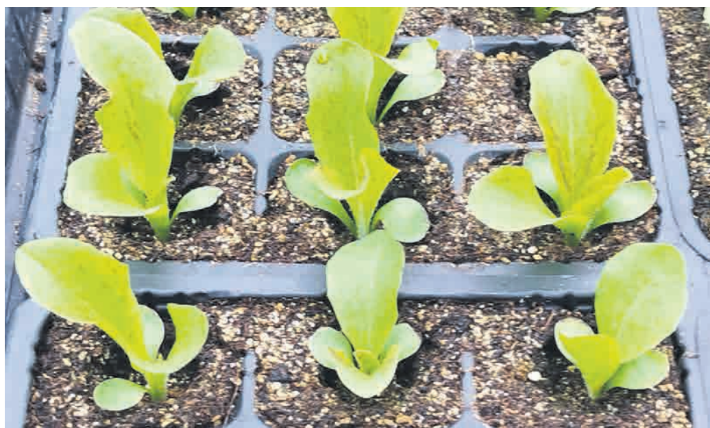
Čas za setev sadik solate je že tu.

Kaj torej že sejemo? Najprej je treba ločiti, ali bomo sadike potem kasneje sadili v rastlinjak (neogrevan) ali na prosto. Za zdaj je smiselno posejati le listnate peteršilj, blitvo, večino zelišč, zeleno, letne sorte solat, nadzemno kolerabico,