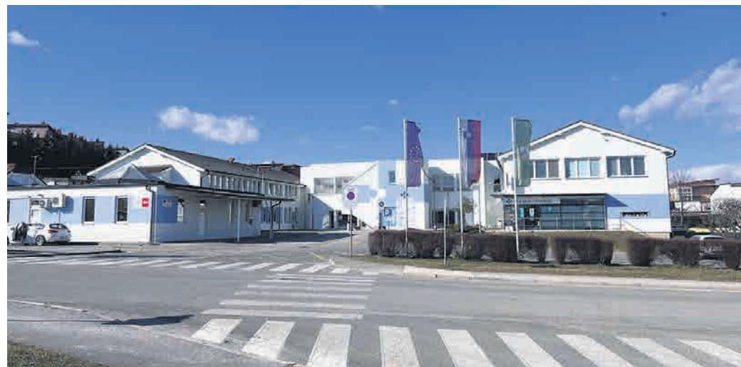
Zdravstveni dom Lenart

S februarjem naj bi sicer v Lenartu vzpostavili dodatno ambulanto družinske medicine, kakor se z novim letom imenujejo nekdanje ambulante za neopredeljene, ki so namenjene pacientom brez izbranega osebnega zdravnika in potrebujejo zdravstveno obravnavo. Kot