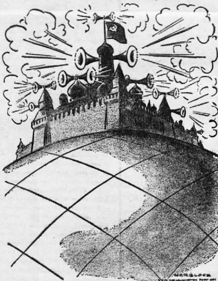
To je velika in sveta naloga vseh radijskih oddaj iz Moskve.