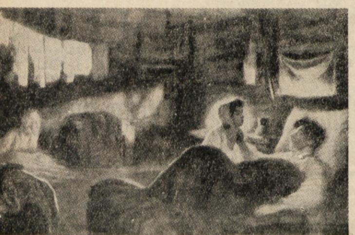
NATAŠA ROSTOVA PRI POSTELJI RANJENEGA KNEZA ANDREJA BOLKONSKEGA. ILUSTRACIJA K ROMANU «VOJNA IN MIR».

Lev Nikolajevič Tolstoj je v svojih delih neštetočkrat upodobil ženo. Toda posebna toplina in čar obdaja tri podobe iz njegovih glavnih treh romanov: podoba Nataše v «Vojni in miru», podoba Ana v «Ani Karenini» in podoba Katjuše v «Vstajenju». Natašo vidimo najprej, kako dorasča sredi mladostne razposajenosti, iger in na pol otroške ljubezenske omane. Nato osliko doma pri Rostovih resni razvoer dorasčajoče mladine. Zvečer igra ona v sprejemnici glavno vlogo. Pred našimi očmi raste in mi opazujevamo, kako se razvija značaj. Vsi navzoči so očarani od njene iskrenosti in živahnosti. Njena mati je za njo mnogo bolj zaskrbljena kot za druge otroke. Ona čuti, da je v njej toliko živahnosti, mladostnega čara in veselja ter da zna vsa ta čustva vzbujati tudi v drugih. Naravno čustvovanje, ki je pri njej tako veliko in globoko, ji daje vse njen čar. Ko je družina Rostovih bežala iz Moskve, je bila prav Nataša tista, ki je zahvalovala, da vzamejo s seboj ranjenca. Mati in oče ustrezela njeni želji. Pohištvo se raztovarja in na vozove položijo ranjene vojake. Knez Andrej, ki je poznal bolje od drugih njeno prisrčnost, iskrenost in globino njenih čustev, je rekel, ko se je spomnil pred borodinsko bitko: «... to njeno du-