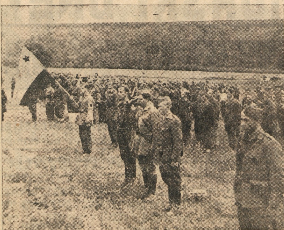
Zbor Bazoviške brigade.