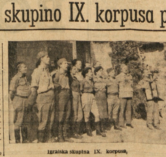
Igralska skupina IX. korpusa.

ko smo imeli v IDRIJI 17. t. m. igralna skupina IX. korpusa odpotovala v CRNI VRH.