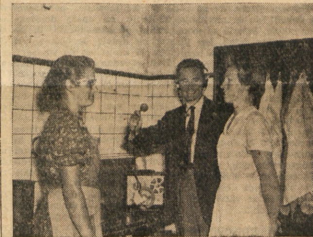
Danske in nemške kmetijske organizacije med seboj izmenjavajo kmetijske fante in dekleta, da spopolnijo strokovno znanje.

Toda najprej pojdi v restavracijo Berns v parku Berzeli v poslovnem delu Stockholma.