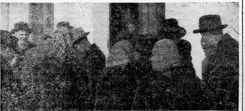
Združniki se pred združnim domom pogovarjajo koga bodo volili v novi upravni odbor.

Mama, kar Mehleta zapišite, saj bo dober, jo je skušala rešiti zadrege mlada združnica, ki je že zvijala vo-