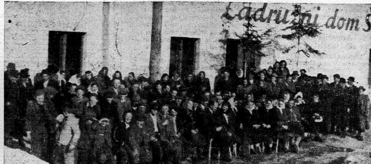
V sredo je bil v Smarju pri Gros upljah občni zbor obdelovalne zadruge. Slika nam kaže del zadržnikov, ki so se udeležili zboru skoraj polnoštevno, med opoldanskim odmorom pred zadržnim domom. (Poroč. na 4. str.)

Iz sekretariata Prezidija Ljudske skupščine LRS,