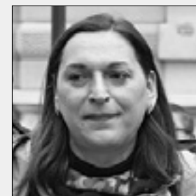
Antonella Nicosia FOTODAMI@N

Policija je prišla na sled osebam, ki so bile vpletene v napad na istospolni par v Ul. Giacinto Gallina pred nekaj dnevi. Kot piše v krajšem sporočilu za javnost, je preiskava stekla takoj po dogodku in zahvaljujoč se delu policijskih preiskovalcev ter nekaterim pričevanjem so obnovili potek dogodkov in identificirali vpletene, med katerimi je baje tudi mladoletna oseba. Zadevo zdaj preučuje sodstvo.