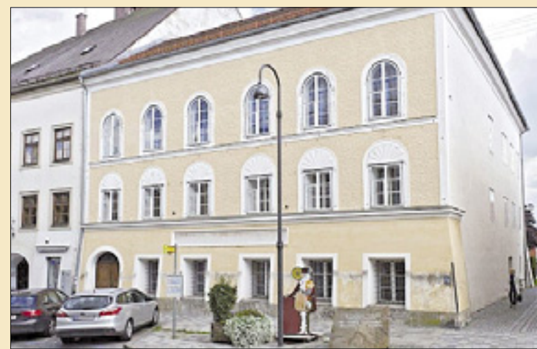
Hitlerjeva rojstna hiša v kraju Braunau am Inn