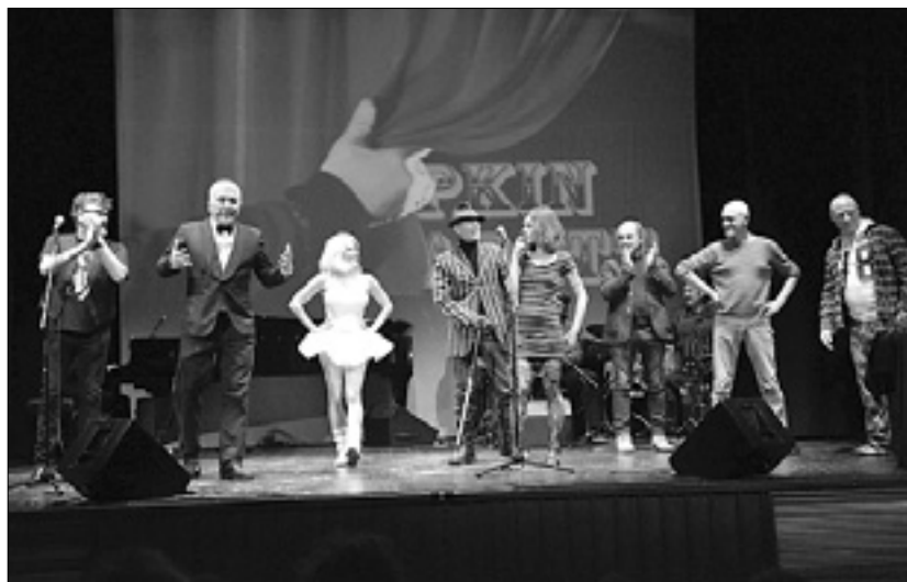
Pupkin Kabarett napoveduje novo vele-predstavo

Ob tržaški kabaretnih tudi umetniško satirična skupina Papu