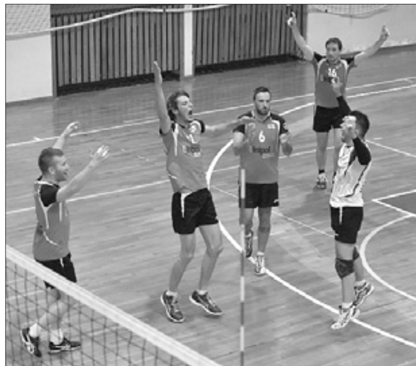
Veselnje odbojkarjev Vala po včerajšnji zmagi

Soča: Cetto 1, Jurij Hlede 1, Čevdek 15, M. Černic 8, A. Černic 3, Cobello 7, Ru-