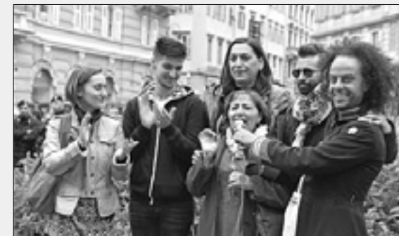
Žrtvi napada in materi istospolnih