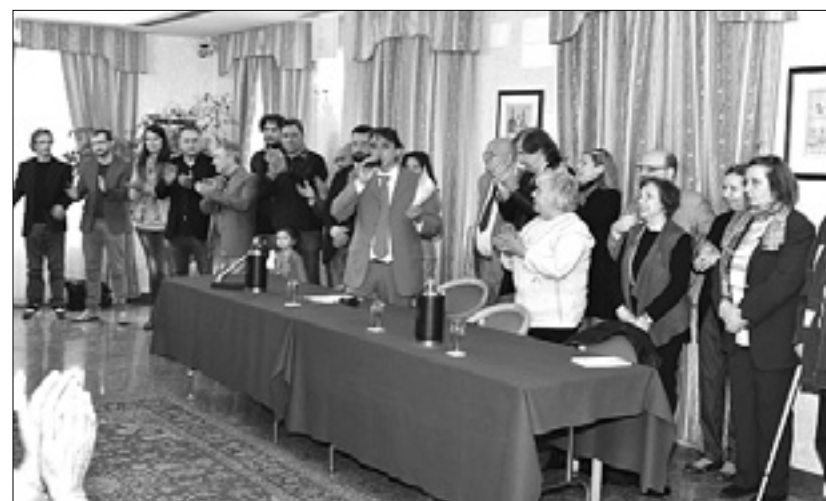
Predstavitev kandidatov v barkovljanskem hotelu Greif