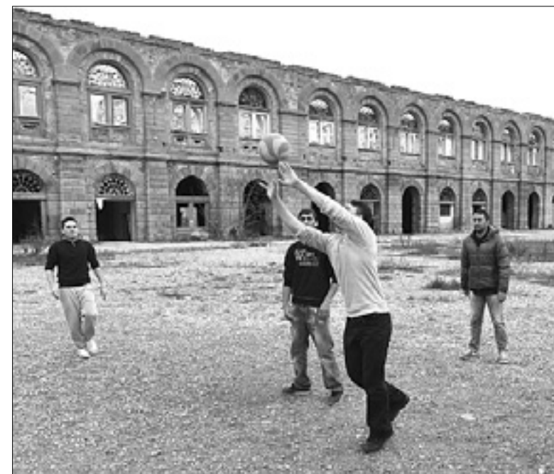
Priseljenci v Trstu