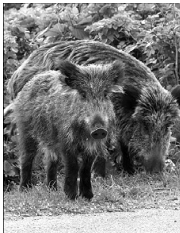
Včerajšnji govorniki (levo), divja prašiča (zgoraj)

naštevjanja je mogoče, da je kakšno število napačno.