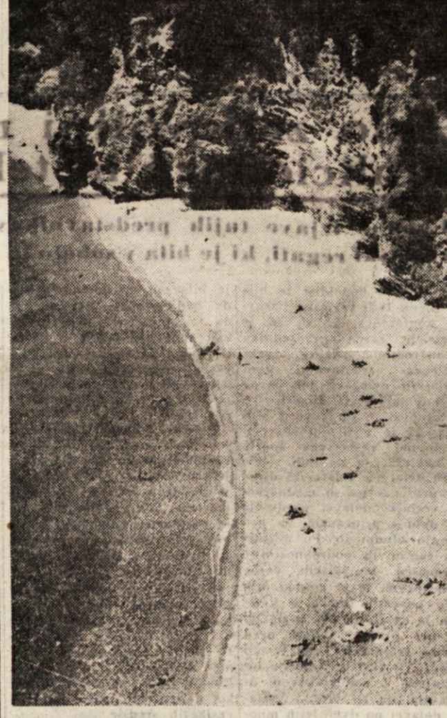
Čudovita slika prirodne lepote ob dalmatinski obali, kjer se človek naučuje sonca in zdravja za vse leto