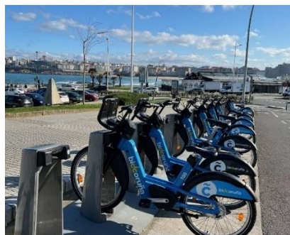
Slika 4: Sistem izposoje koles Bicicoruña v mestu A Coruña.