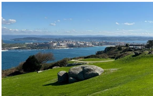
Slika 2: Pogled na mesto A Coruña iz griča Monte de San Pedro.