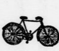
Dvokolesa, motorji, vitrički