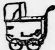
Oroški vozčki najnovejših modelov

Založba Hram, Ljubljana, Florjanska ulica 14.