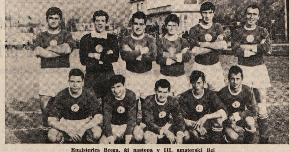
Enajsterica Brega, ki nastopa v III. amaterski ligi