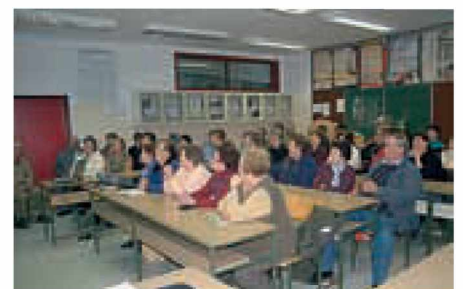
Predavanje o vrtovih in ogradih