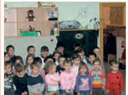
Vrtec z otroki in novo avdio-video opremo

Kot največja pridobitev v letošnjem šolskem letu za naš vrtec pa je bil vsekakor nakup avdio-video opreme. Ob tej priložnosti smo pripravili slavnostni prevzem, ki smo ga popestrili s kulturnim programom. Ob taki priložnosti pa sledi tudi prerez traku, ki so ga opravili otroci, katerim je ta pridobitev tudi namenjena. Vsega tega pa ne bi bilo brez pomoči staršev, ravnatelja OŠ Grad in donatorjev, ki so nam pomagali z denarnimi prispevki.