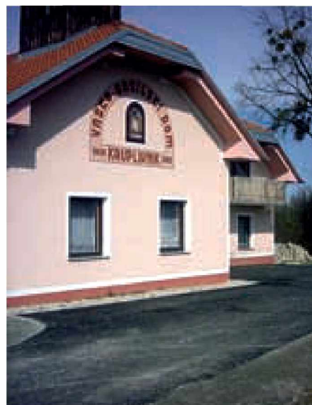
Asfaltirana cesta pred gasilskim domom