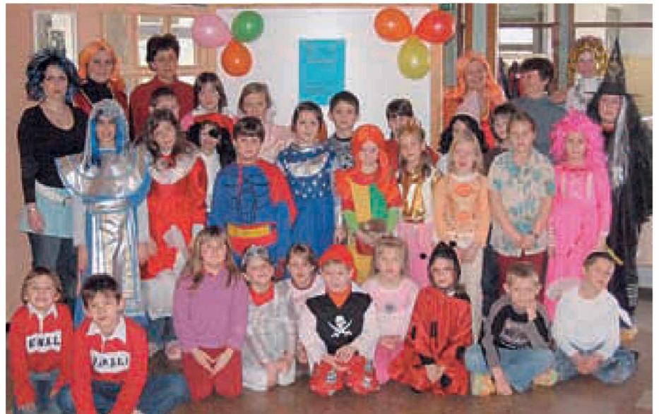
Na pustni torek smo se tudi našemili