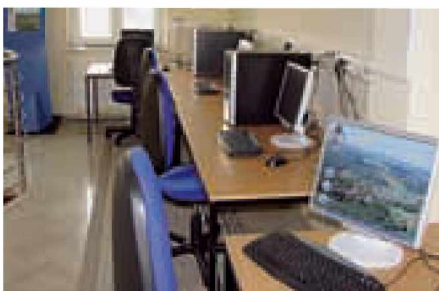
Štirje računalniki v avli občinske stavbe