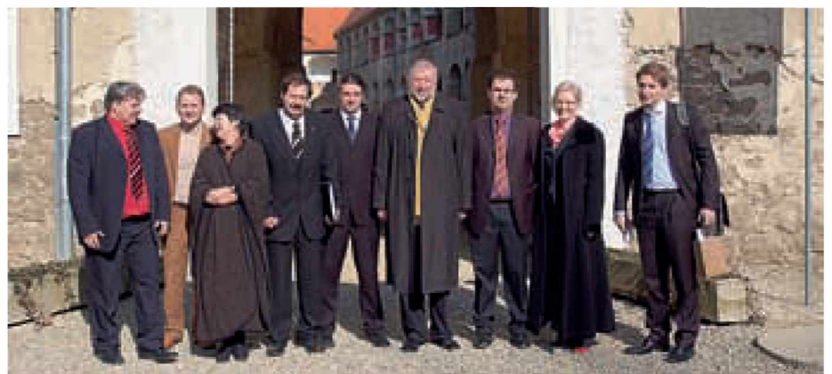
Obisk ministra Rupla