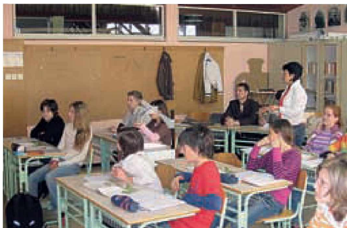
Vzdušje je bilo zelo delovno