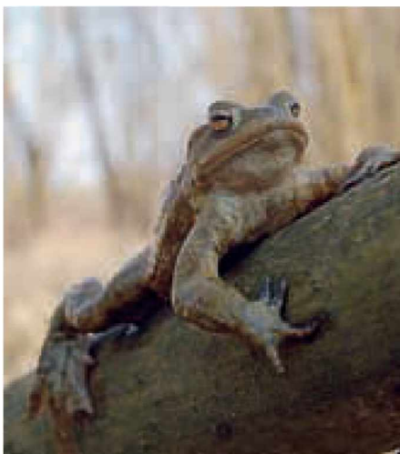
Samček navadne krastače