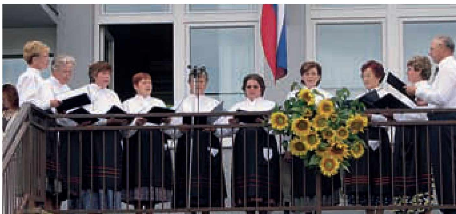
Ljudski pevci radi zapojejo pred domačim občinstvom

Ljudska pesem in ljudske viže združujejo ljudi, jih razvedrijo in ne poznajo meja. Glasba je kot človek, ki zna čutiti, je vesela, je otožna, je naša. Tako smo se počutili tudi mi na Srečanju ljudske glasbe pri Mali Nedelji.