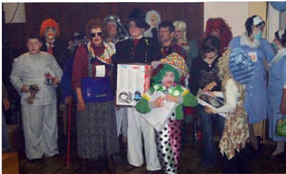
Izbrane so bile najlepše in najbolj izvirne maske.

Nekoč je za pusta po vasi teklo veliko maškar. Staro in mlado se je veselilo, hodilo od vrat do vrat in prosilo za sladkarije in krofe. Otroci pa so imeli najraje, če je v žepu kaj zažvenketalo. Takrat v trgovinah še ni bilo takšne izbire kostumov kot danes. Izdelovanje kostuma je imelo zato še poseben čar. Poiskali so blago in stare obleke ter jih preuredili v kostume za princese, vile, živali in podobne like. Otroci so nestrpnost čakali dan, ko so se lahko našemili.