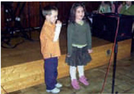
Mamicam so zaželeli vse najboljše prav najmlajši