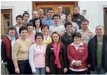
Delavnica Sonnengartl