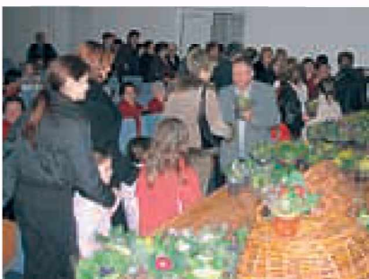
Ženske in dekleta so člani KD razveselili s cvetjem