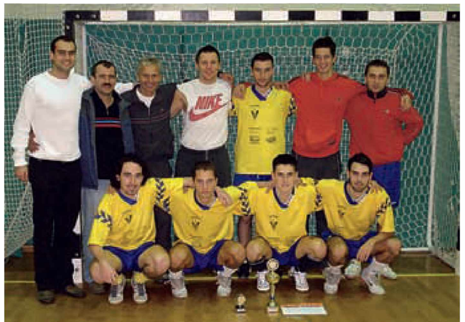
Zmagovalna ekipa »Na jasi« Bodonci