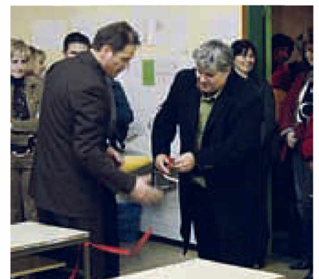
Nova računalniška oprema je bila predana svojemu namenu

tehnologijo, s tem pa tudi boljše pogoje za vzgojno-izobraževalno delo.