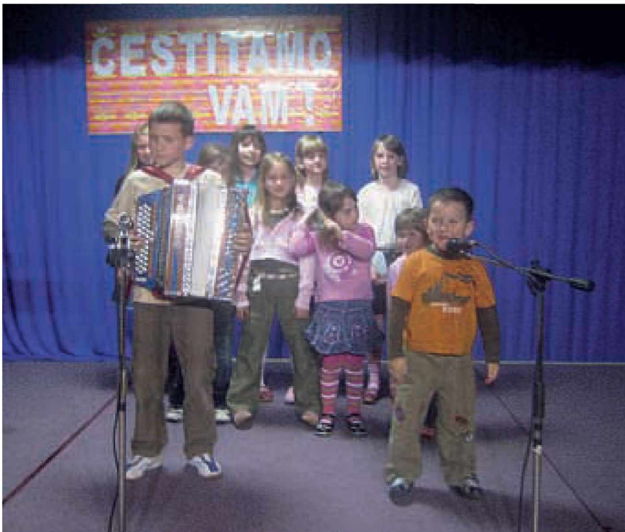
Najmlajši so pripravili lep program