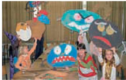
Igranje z lutkami

Na Osnovni šoli Grad smo organizirali meddržavni lutkovni tabor, ki je potekal med zimskimi počitnicami od 19. do 21. februarja 2007. Udeležilo se ga je 30 otrok od prvega do četrtega razreda iz OŠ Puconci, OŠ Sveti Jurij in OŠ Grad. Tabora sta se udeležila tudi dva učenca iz OŠ Jožefa Košiča z Gornjega Senika na Madžarskem. Pripravile smo ga učiteljice prve in druge triade z namenom, da si otroci razvijajo finomotorične spretnosti, komunikacijske spretnosti, domišljijo in ustvarjalnost in da se predvsem med seboj