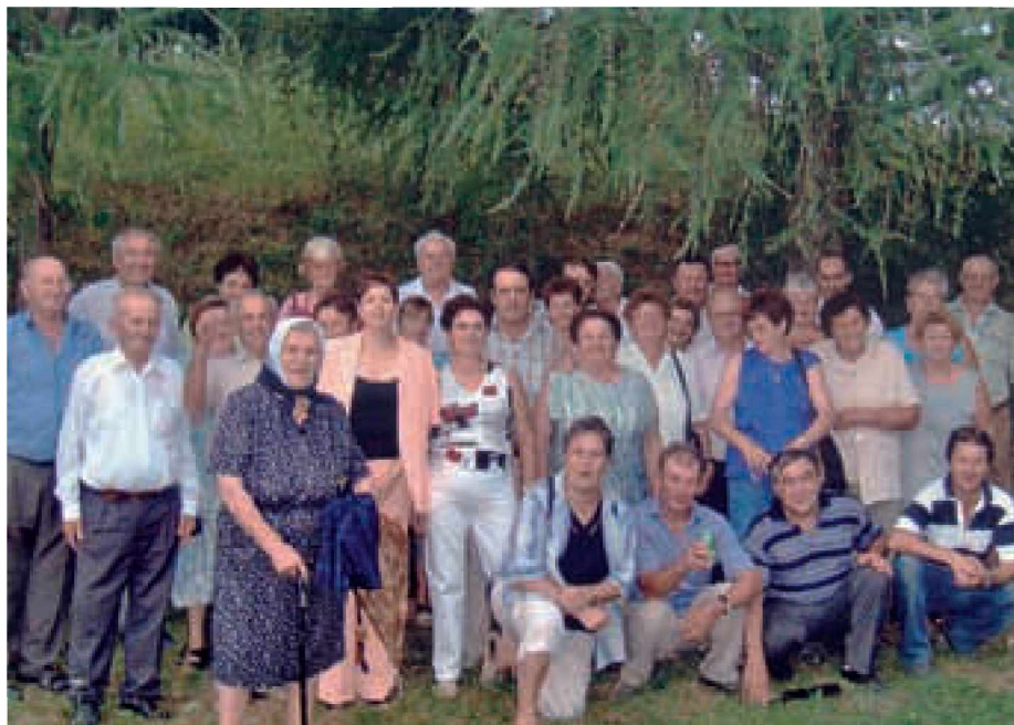
Upokojenci na izletu v Kumrovcu

dolžili novo vodstvo, da poskrbi za vpis društva v register. Vpis v register društev je bil opravljen 5. februarja 1999 in od takrat uradno obstaja naše društvo.