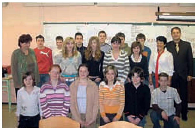
Sožitje naših in porabskih učencev