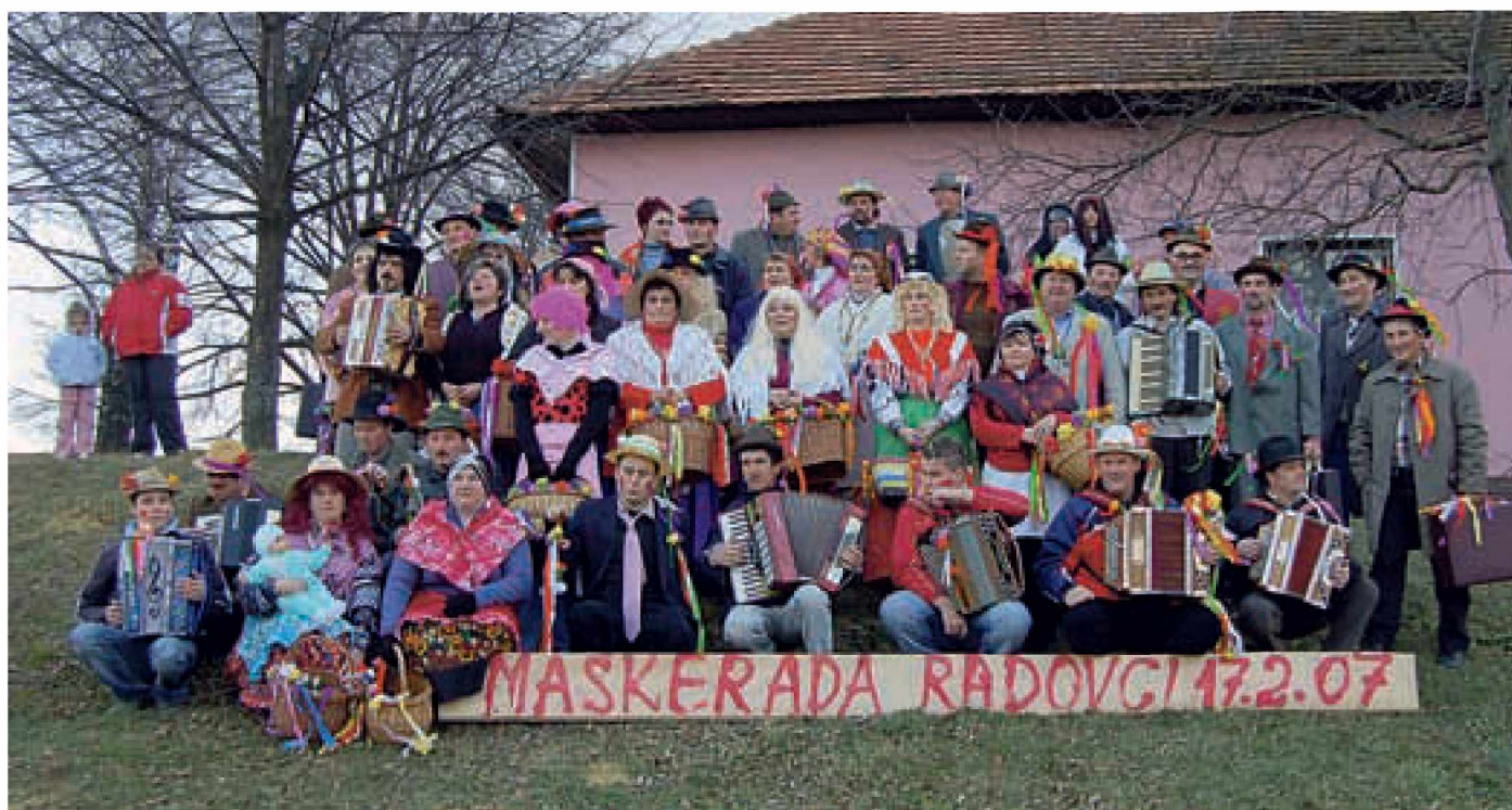
Naše rajanje se je začelo že pred samim pustom.

si poleg tega privoščili še obilo pijače in hrane. Vse to je bilo dovoljeno, vse to smo počeli, pa nam nihče ni smel ničesar zameriti.