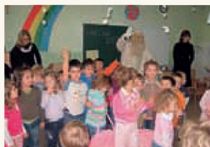
Dedek Mraz med otroki