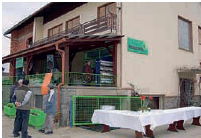
Trgovina Rodovita na Dolnjih Slavečih

Trgovina ima 520 m 2 . Prodajnih prostorov je 70 m 2 , skladišče zavzema 300 m 2 , 150 m 2 pa je tudi na prostem. Ponudba kmetijsko-gradbene trgovine je zelo ob-