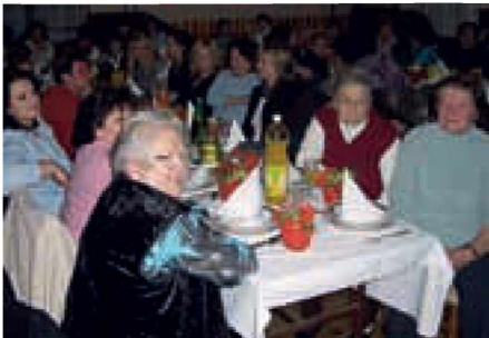
Ob prazniku sta se zbrali starejša in mlajša generacija

Mamica ljubljena, kaj si želiš, ko se na praznik zjutraj zbudiš?