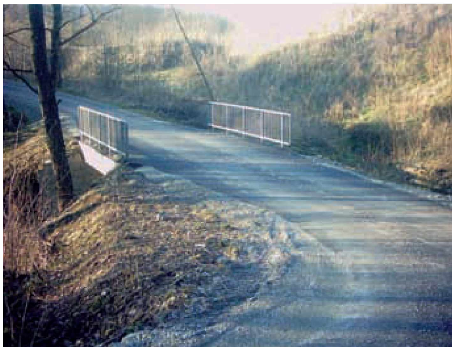
Most v Kruplivniku