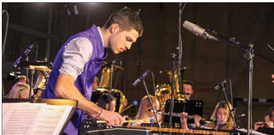
Skladbe je obogatila vrsta solistov, ki so pred okoli 900 obiskovalci suvereno odigrali svoje vložke.