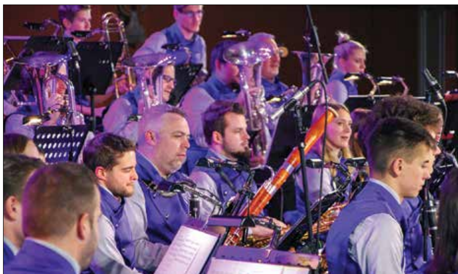
Harmonija skladb iz risank in animiranih filmov je občinstvo vrnila v čase mladosti.