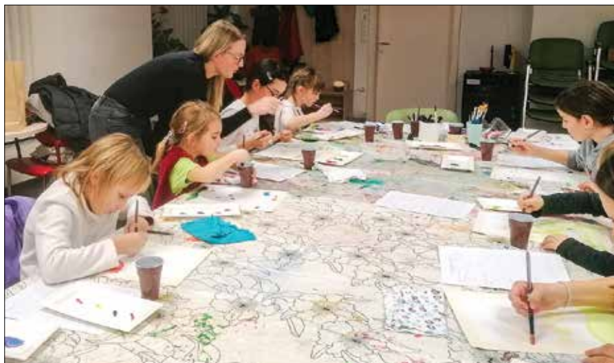
Ob pomoči mentorice so se otroci na likovni delavnici prelevili v prave umetnike.