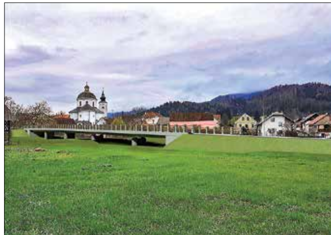
Po besedah župana Špeha bo viadukt čez Dreto zelo lep, saj so bile zahteve spomeniškega varstva zelo stroge zaradi bližine gornjegrajske katedrale.

zagotovo zapisalo v zgodovino našega kraja in okolice. Sam infrastrukturni inženirski objekt viadukt čez Dreto bo zelo lep, ker so bile zahteve spomeniškega varstva zelo stroge zaradi bližine