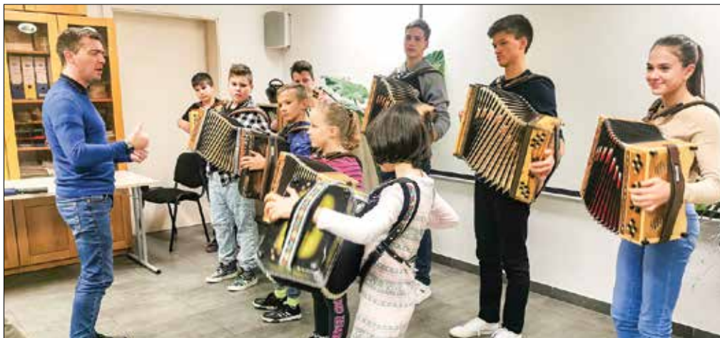
Mladi harmonikarji so na reviji pokazali svoje znanje in ljubezen do igranja harmonike.