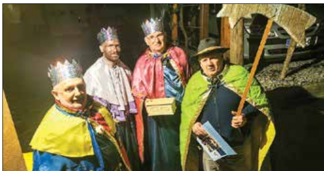
Koledniki KD Jurij so obiskali Ljubijo, Gneč, Podvrh, Trate, oglasili pa so se tudi v Nazarjah pri sestrah klarisah.