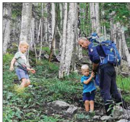
Planinska kočica Farbanca je priljubljena pohodniška točka.