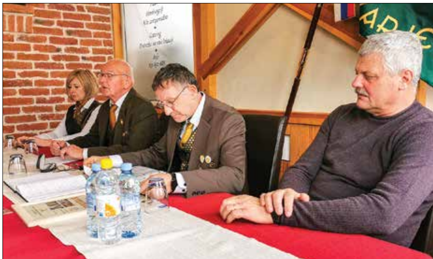
Kokarski čebelarji se bodo posvečali ohranitvi kranjske sivke, avtohtone pasme slovenske čebele.