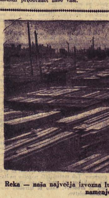
Reka — naša največja izvozna luka. Pogled na skladovnice za izvoz namenjenega lesa