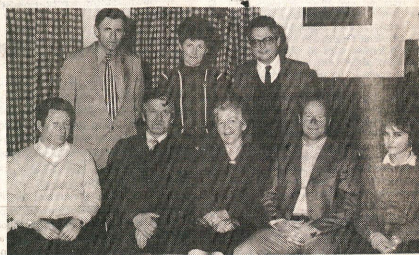
Predstavniki KS Rova