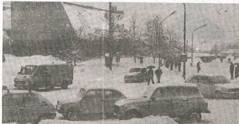
Zametlo nas je 6. Od 10. pa tja do 14. januarja je šlo kot za stavo. Snežilo je po cele dni. Zametlo je tudi center Domžal.