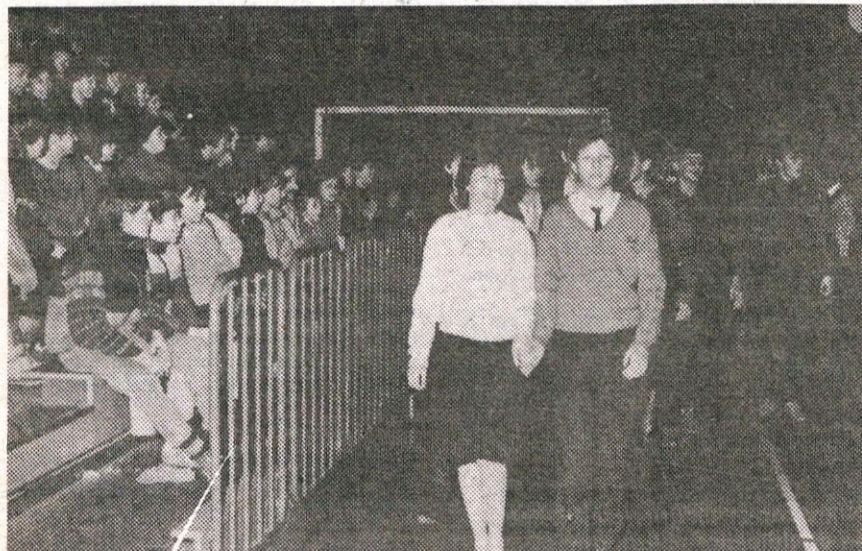
Plesno tekmovalce učencev domžalskih osnovnih šol.

Usnjeni izdelki PAVLI NATAŠA Ljubljanska 91, Domžale