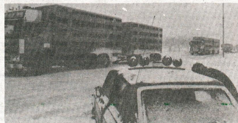
Zima je huda reč, če te najde na cesti, kot je našla te tuje tovornjake...