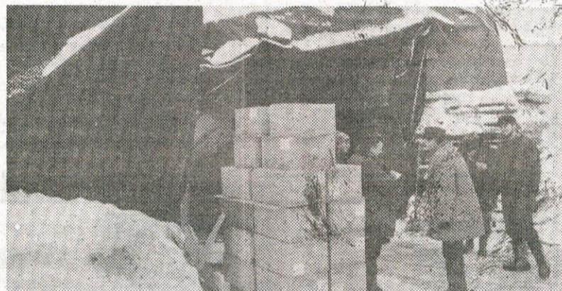
V Tosami je podrla šotor — skladišče. Ne jezi tolko podatek o škodi, kolikor novica, da nekateri delavci Tosame niso hoteli prijeti za lopate rekoč: Ne plačujejo me za kidanje snega... Prav bi bilo, da bi — ko bodo snežne zagate mimo — vzeli pod drobnogled lenuše tudi še kje drugod, ne le v Tosami.