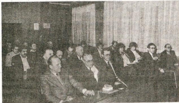
Pogled na udeležence svečane prireditve občinske raziskovalne skupnosti.