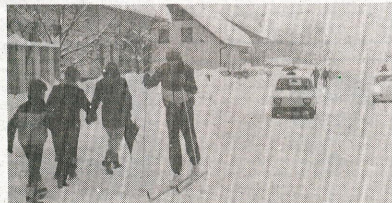
Šlo je tudi s smučmi. Posnetek iz Preserij.