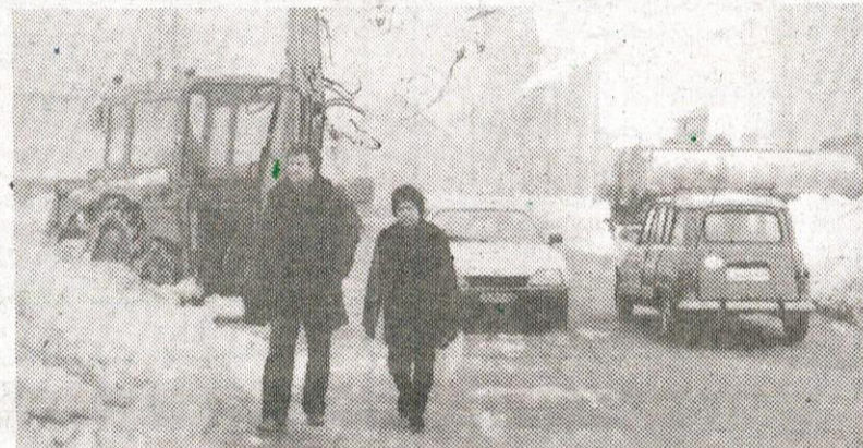
Lotili smo se ga (snega) bolj z mehanizacijo, kot z lopatami. Zato pa je tako, da so nekatere (ker se sami niso potrudili) odkopali šele po dobrem tednu... Lenoba pa taka...