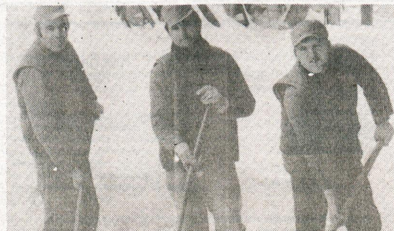
Tle možakarji so »odkopali« žitov silos na kolodvoru ob progi. Posnemati bi jih bilo treba.