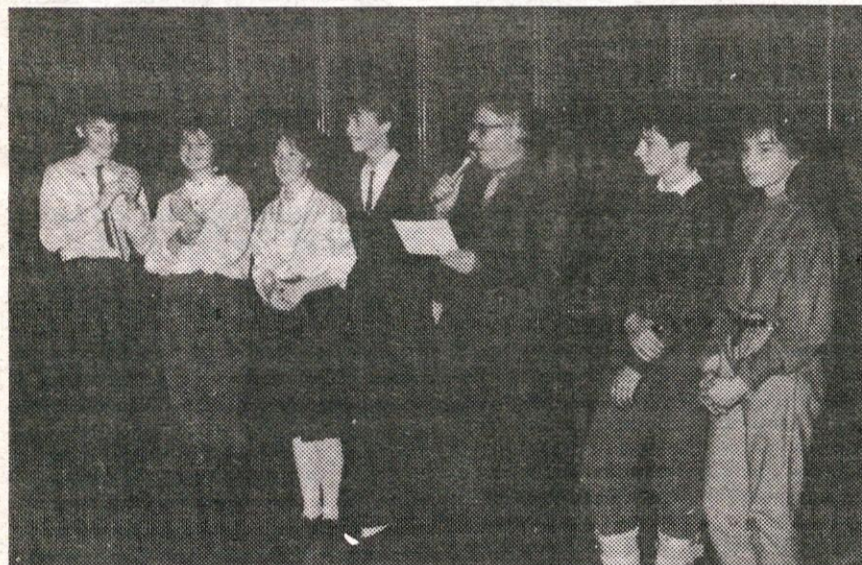
Zmagovalci plesnega tekmovanja v šoli Vencija Perka.