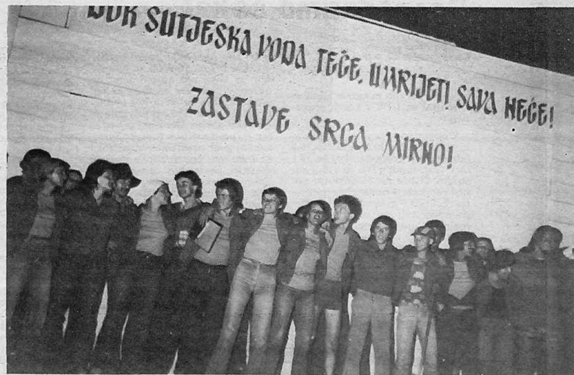
Kjer dobri so ljudje, pesem je doma!