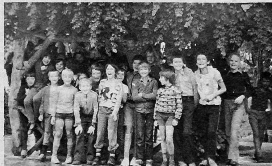
»Sredi morja črna vihra...«