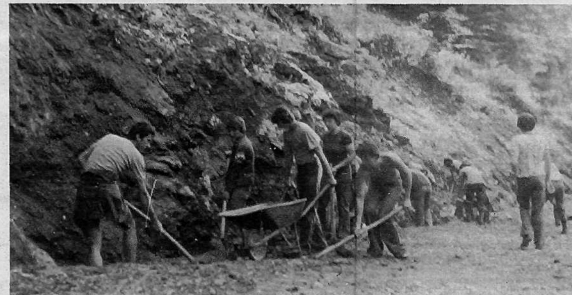
Dekleta in fantje iz Centra gradijo pot, ki bo vodila h kraju, kjer je bil med sovražno ofenzivo ranjen tovariš Tito.

tre dolgega vodovoda od izvira Skakavca do Tjentišta in daljnovečja. Lahko vam povem, da so vsi brigadirji zelo pridni tako na trasi kot v naselju, da so vaši Ljubljanci zelo marljivi graditelji. Med brigadirji je četrtina deklet, zastopane pa so vse mladinske strukture: šolska, vaška, delavska, stu-