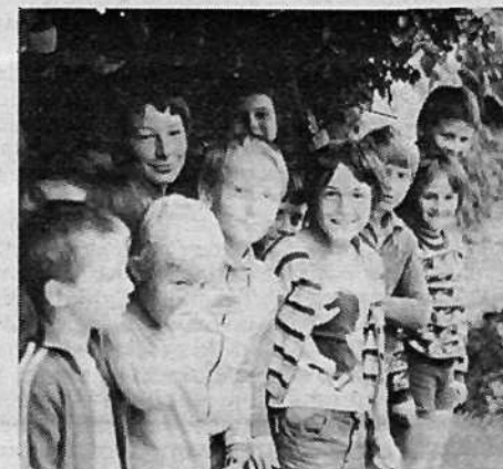
Pa recite, da niso kljukci (če pa so)!

bi pomagale. Najraje pa so pomagali peljati voziček po klancu navzdol (znajdljivi so, ni kaj)! Pravo veselje je bilo peči krompir na žerjavici, pozanimali pa so se tudi, če je res, da krava daje mleko. Največji