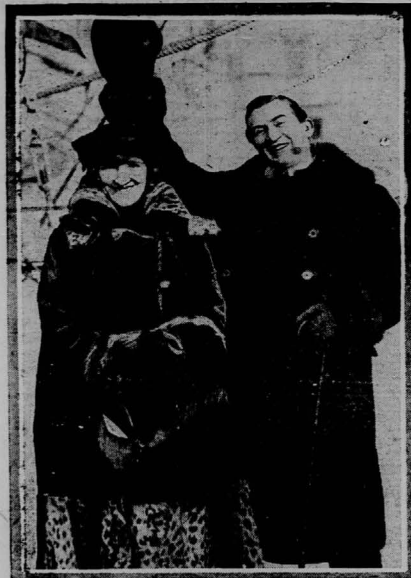
SLAVNI ANGLEŠKI GODBENIK