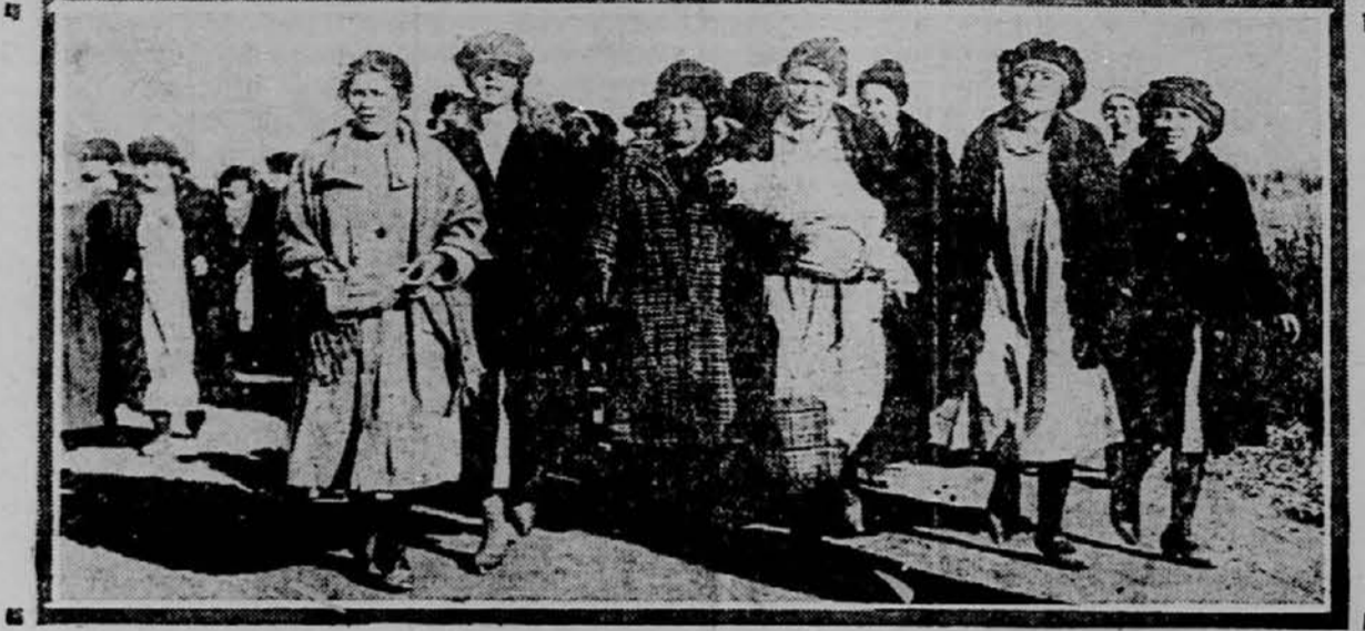
ULOGA ŽENSK V KANSAŠKI STAVKI. Pred kansaškimi promogovniki pekctirajo ženske ki ne pustje skobe ra dela. Večkrat je prišlo do vrođih spcpadav. Proti tam ženãkam niti vojãstvo ne more veliko oprãviti.