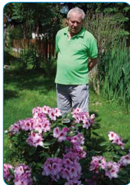
Tak, kak je ženi obečo, skrbi za rouže in gračenek

delo v bauti, v trej mestaj, pa ške tam, gdé so kište redili.