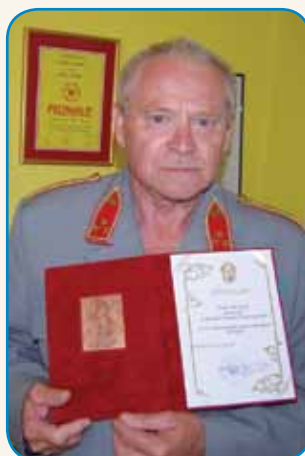
Rad je delo z mlajšimi stran 10