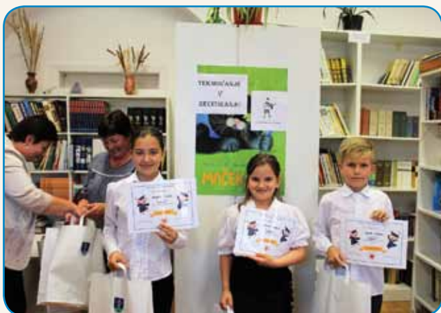
Recitali smo slovenske pesmi stran 2