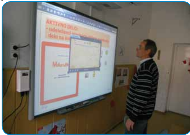
Števanovski učitelj Laci računa s pomočjo interaktivnega gradiva

V ponedeljek, 15. maja 2017, smo učitelji in učiteljice - vključno z ravnateljicama obeh dvojezičnih narodnostnih šol v Porabju - opravili še drugi del izobraževanja, in sicer v sklopu projekta „Dvig kakovosti narodnostnega šolstva za madžarsko narodno skupnost v Sloveniji ter slovensko narodno skupnost na Madžarskem“, preko katerega ima gornjeseniška šola tudi štiri leta zagotovljeno stalno strokovno pomoč iz Slovenije.