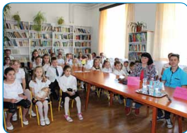
Knjižnico seniške šole so napolnili praznično oblečeni učenci