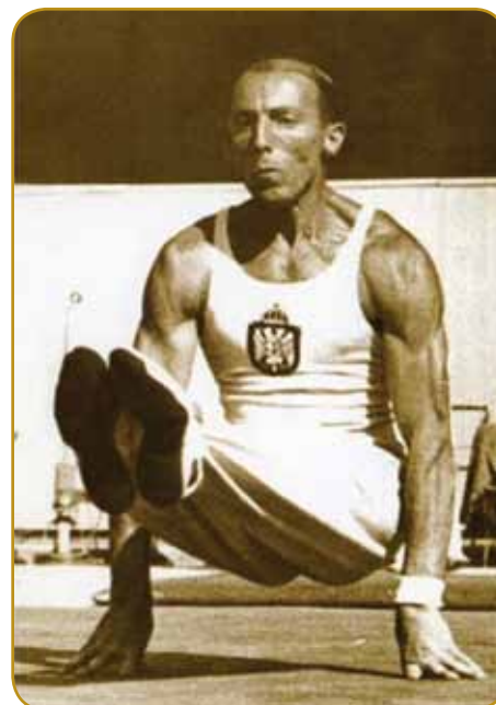
Telovadec Leon Štukelj je na olimpijadaj daubo 6 medalj in biu prvi »zlati« med Slovincami

lüstvo na njinoj strani. Voditelji stranke so pelali avtonomistično ali federalistično politiko, vej je pa v Kraljevini SHS bilau največ pravoslavni vörnükov. Pred vpelanjom diktature je SLS dobila glase za trifrtale vsej poslancov v parlamenti. Gda pa je stranka prišla v jugoslovansko vlado, je brž pozabila na svoja stara obe-