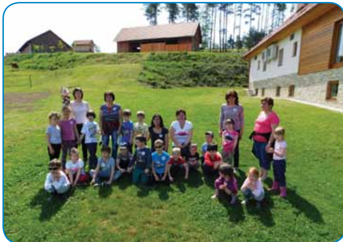
Skupinska slika pred kmetijo

zahvalili Zvezi Slovencev na Madžarskem in vodji Vzorčne kmetije na Gornjem Seniku