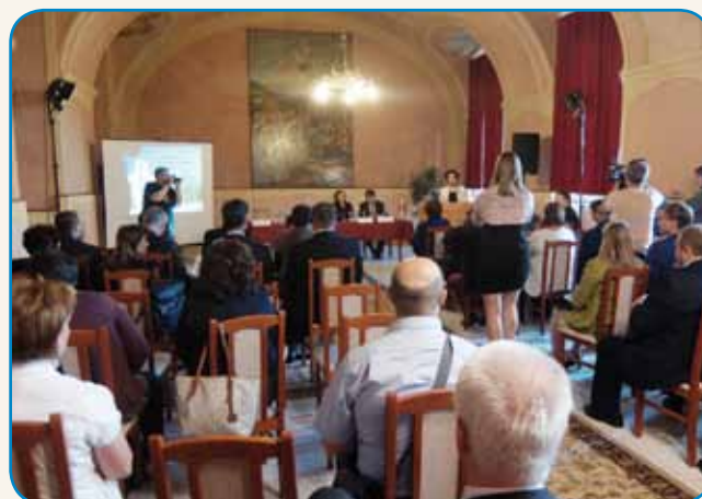
Monoštrski forum stran 5