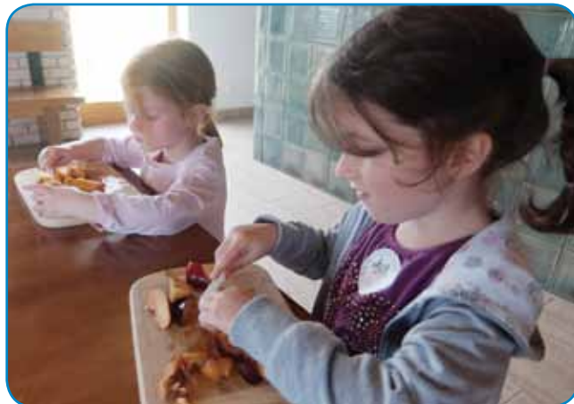
Malčki so pridno pomagali pri pripravi sadne solate