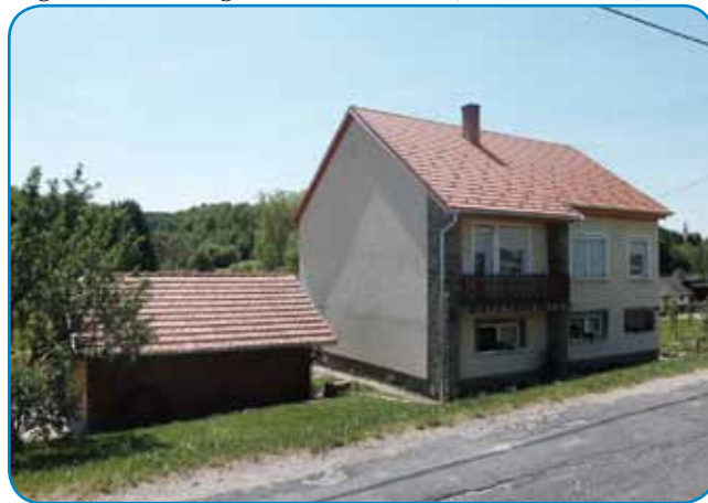
Iža stoji na tistom tali, steromi se pravi Graba

- Ka te zdaj delate, gda ste že v penziji pa foci že tō nega, ka bi leko gledali?