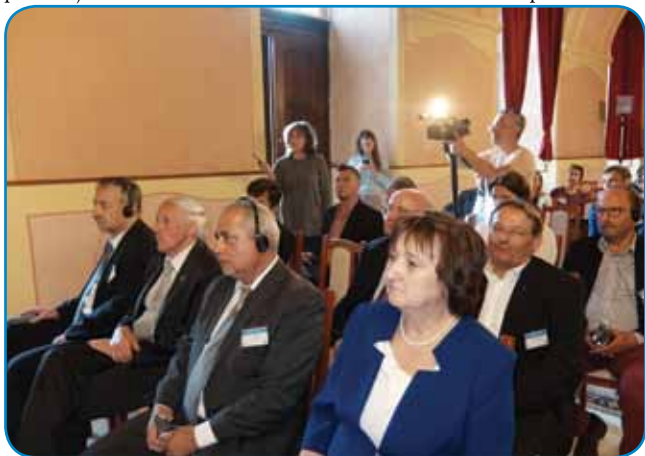
Del udeležencev na otvoritvi Monoštrskega foruma

in z namenom izmenjave idej, predlogov za razvoj in iskanja partnerjev za uresničitev kon-