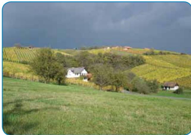
V severovzhodni Sloveniji, v bližnji avstrijski Štajerski in še kje so vinogradi, kjer pridelujejo sorte grozdja za odličen (dišeči) traminec

se udeležujejo vinarji iz Avstrije, Italije, Hrvaške, Francije, Švice, Nemčije in Češke. V pokušino, ob odlični kulinariki, ponudijo prek 100 vrst tramincev iz skoraj vseh vinorodnih okolišev, znanih po pridelavi te sorte vina. Vseskozi je program popestren s kulturnimi dogodki in umetniškimi dogodki (z branjem poezije - domačih in tujih avtorjev, udeležencev mednarodnega festivala Poezija in