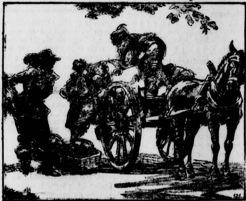
Zwölf Flaschen Wein

Die Herren Athos, Porthos und Aramis saßen vor einigen Tagen, als sie sich eine freie Zeit bei mir aufschließen hatten, einen solchen Lärm, daß der Schloßhauptmann, ein sehr gestrenger Herr, ihnen einige Tage Stubenarrest diktirte. Sie haben mich beauftragt, Ihnen 12 Flaschen Anjou-Wein zugehen zu lassen. Der Wein ist von einem Jahrgang, für den sich die Herren besonders begeisterten. Die Herren bitten Sie, den Wein auf ihr Wohl trinken zu wollen. Ich verbleibe, mein Herr, Ihr ergebenster Diener GODEAU Marketender der Herren Musketeere.