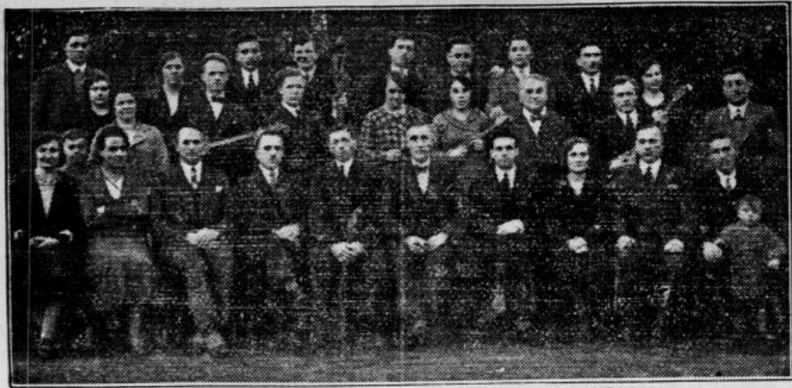
Tamburaški klub »Domovine glas« v Eyselshovnu