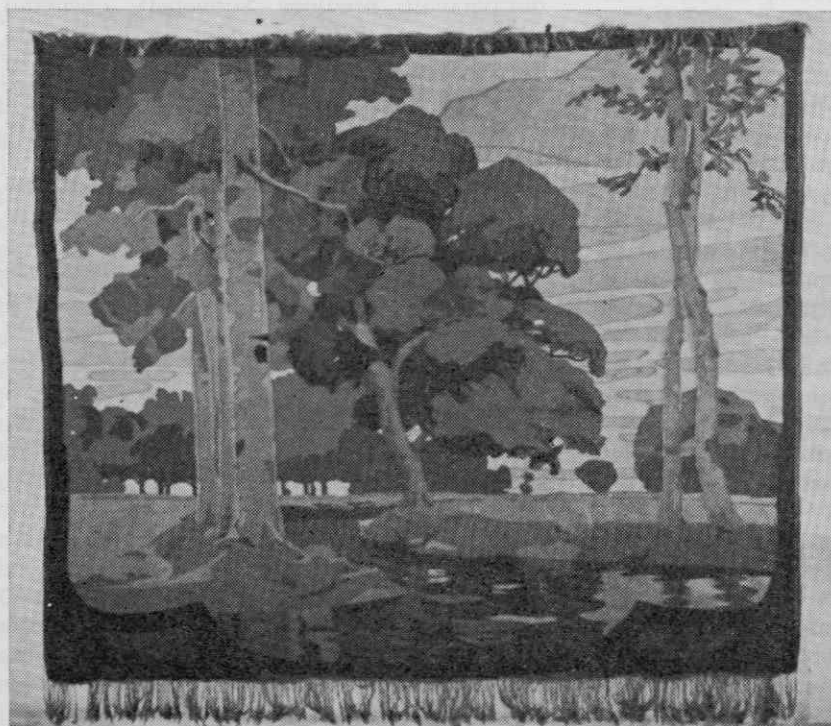
JESENSKA KRAJINA — stenska preproga; tapiserija, volnen votek na bombažni osnovi. Signirana FR 1. sp. in KKWA d. sp. Izdelek Kranjskega zavoda za umetniško tkanje v Ljubljani ok. 1903. Karton Raoul Frank. Velikost 120,00 krat 170,00 cm. Last: Narodni muzej, inv. št. KZ-20331

Razlogov za propad KZUT je prav gotovo več. Med drugim tudi dejstvo, da so v okviru gibanja za oživitev umetniškega tkanja in preporod tapiserije nastajale številne delavnice in drobne manufakture in je bila ob koncu 19. in v začetku 20. stoletja ponudba nenadoma veliko večja od dejanskega povpraševanja. Namero, da bi likovno neoporečni in po tehniški izdelave kakovostni izdelki uspešno tekmovali s cenejšimi industrijskimi izdelki, bodisi za vsakdanjo rabo, bodisi za okras, je bila v tem času kajpak preveč idea-