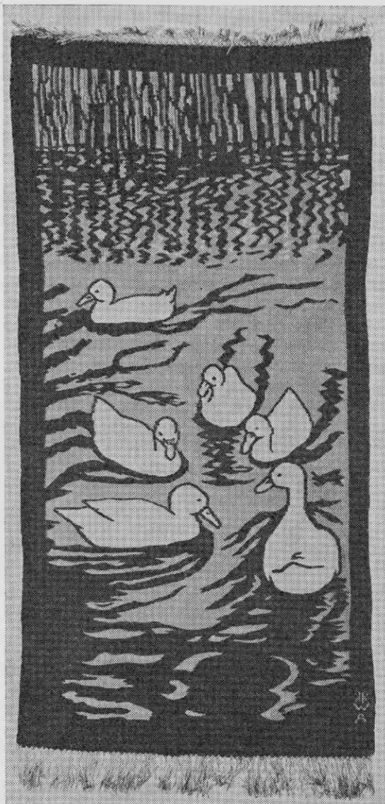
RACKE — stenska preproga; tapiserija, volnen votek na bombažni osnovi. Signirana KKWA d. sp. Izdelek Kranjskega zavoda za umetniško tkanje v Ljubljani, ok 1903. Karton S. Tuarko. Veličost: 140,00 × 72,00 cm. Last: Narodni muzej, inv. št. KZ-20521

Druga januarja 1899 se je torej začel tečaj (10), ki ga je sprva obiskovalo deset, pozneje pa osemnajst učenk. O sprotnih dogodkih je izšlo še nekaj notic (11, 12) iz katerih tudi izvemo, da je marca tečaj obiskovalo že dvajset učenk in da naj bi KZUT v bodoče zaposlovalo celo 60 — 100 tkalk. Zaradi te predvidene razširitve so nameravali obstoječe prostore zamenjati za večje. Takrat je prišel v Ljubljano tudi dunajski arhitekt Rudolf Hammel, ki ga je za kartonista in načrtovalca ostalih osnutkov priporočil dvorni svetnik Scala, ravnatelj Avstrijskega muzeja za umetnost in industrijo (12). Vsi ti podatki nam povedo, da je bilo za popularizacijo KZUT storjenega sorazmerno veliko pa tudi to, da KZUT ni bila le ljubljanska pa tudi