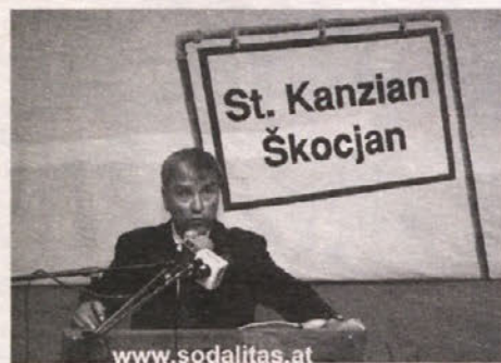
Predavanje prof. Pelinke v nabito polni dvorani je bilo zanimivo in spodbudno

strani pa se vsako leto v oktobru zbirajo na Vrhu nekdanji pripadniki Waffen-SS in drugih militarističnih organizacij. Ti so nekoč glasno zahtevali in se zavzemali za priključitev Avstrije k rajhu. »Odpor koroških Slovencev nekateri še vedno