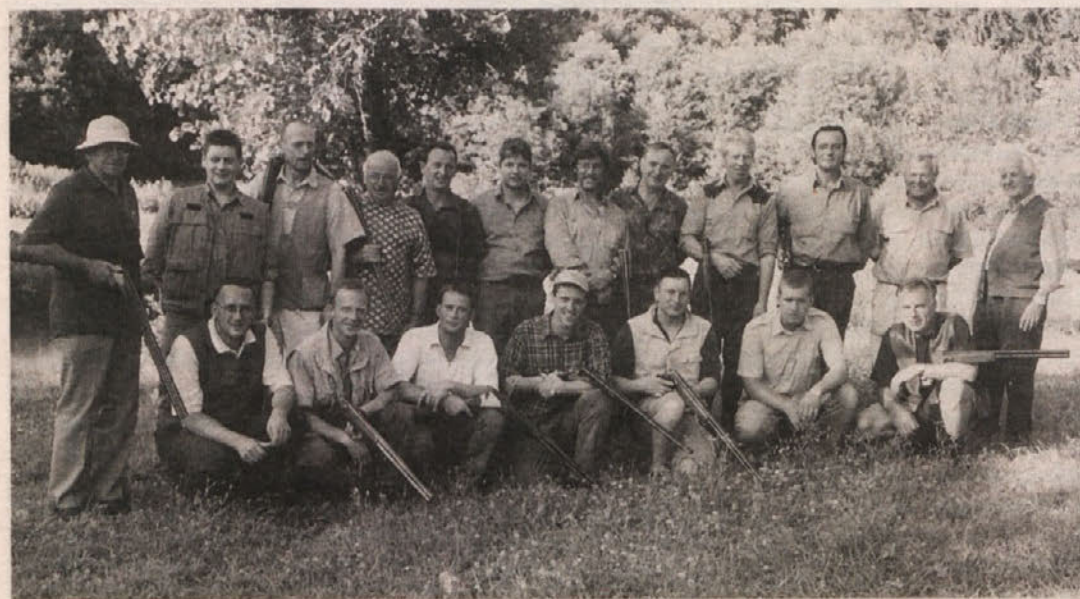
»Gasilska« slika udeležencev sobotnega streljanja KPL pri Štihu