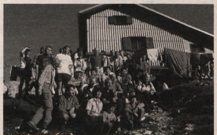
Slovenski koroški planinci na Kriških potih

Če bo dež, bo prireditev preložena na 25. 8. ob 18. uri.