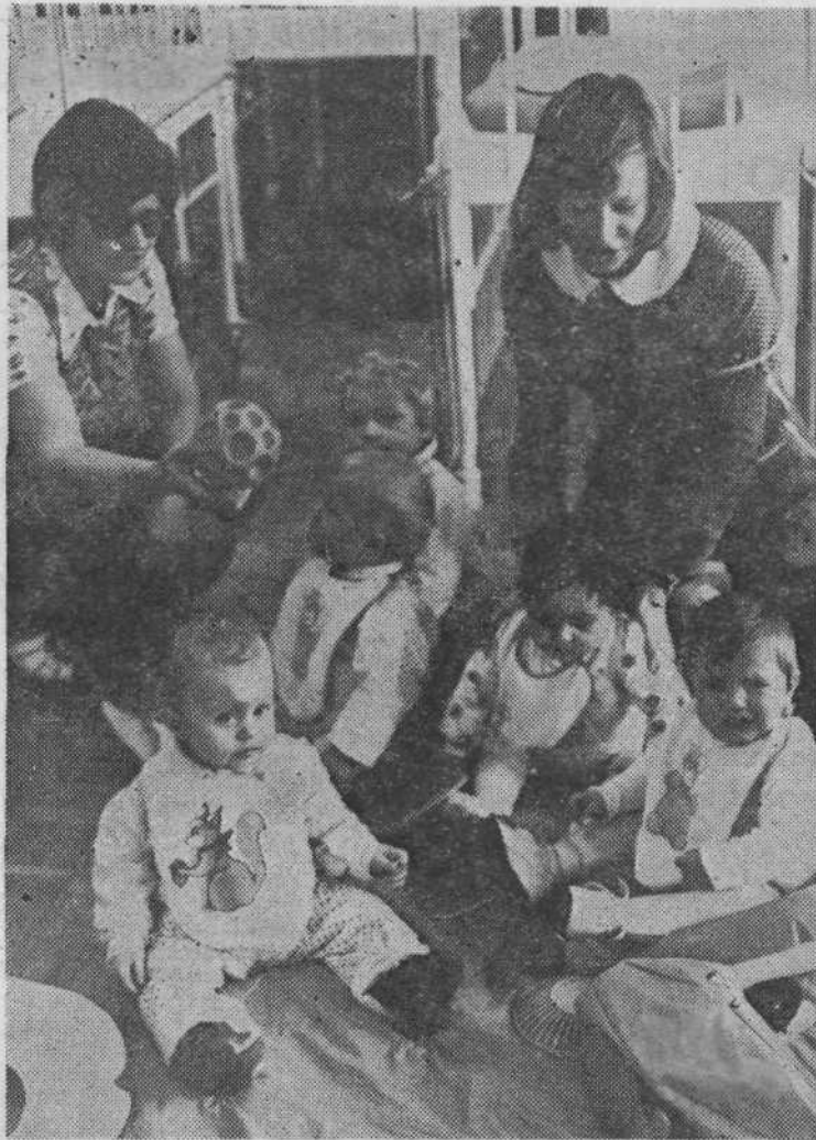
Tako! Čim manj joka in čimveč smeha nad slinčki z lepimi živalcami!