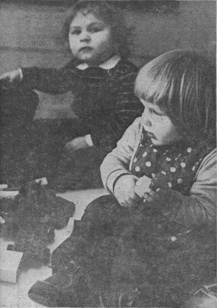
Če se natanko pogleda, so lego kocke čisto pripravne