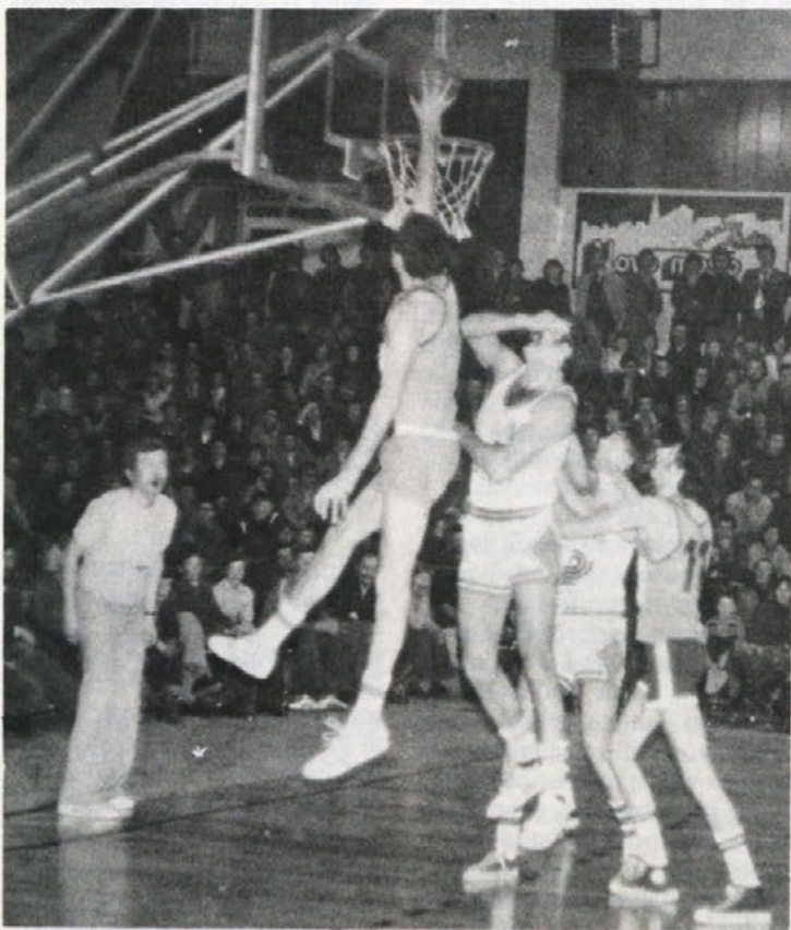
Na sliki posnetek minulega srečanja med Brestom in Dolenjsko