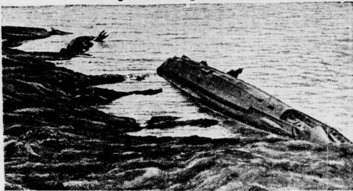
Na cornwalskem nabrežju v bližini Falmoutha stoji »pokopališče« angleške mornarice. Tam ostavljajo nerabne podmornice njih usodi