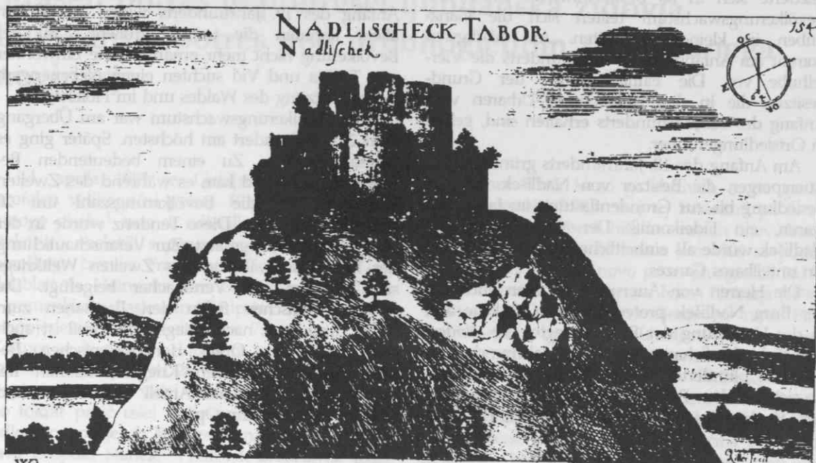
J. W. Valvasor, Topographia ducatus Carnioliae Modernae . Cankarjeva založba, Ljubljana, dr. Rudolf Trofenik, München 1970.

nota se zopet zarašča. Le redki še vstrajajo, kraji pa izumirajo. Dolga doba je bila potrebna za njihovo kultiviranje, malo je potrebno, da se povrnejo v prvotno stanje.