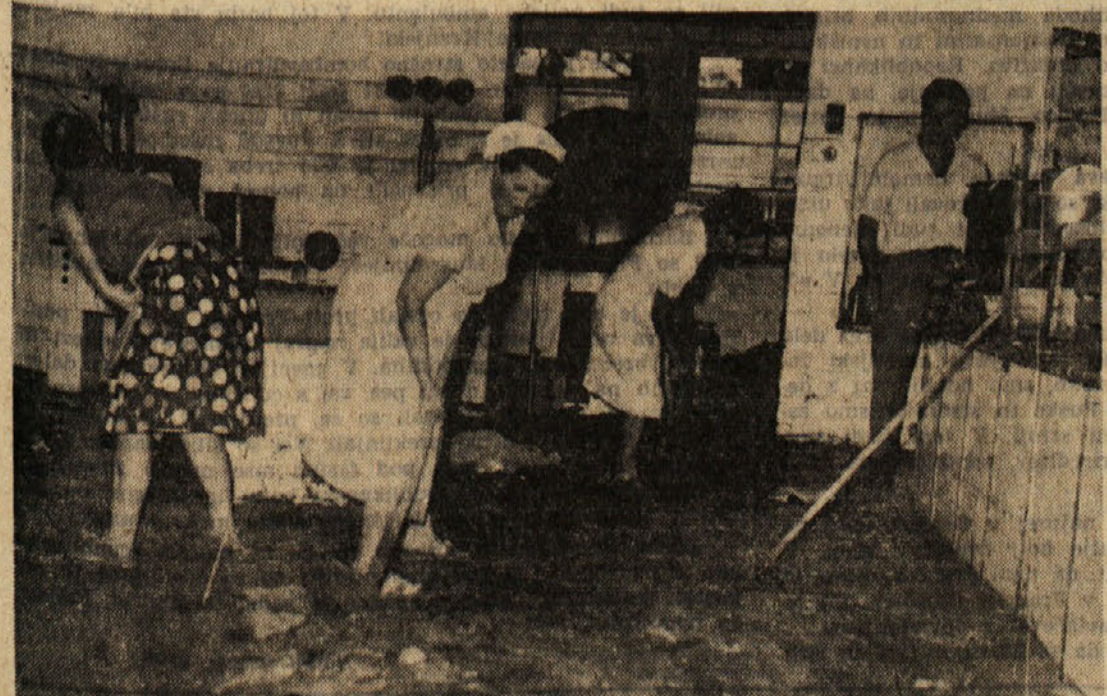
Velikansko škodo je neurje povzročilo tudi na jugoslovanski strani meje, predvsem v Ankaranu, kjer je voda med drugim vdrla tudi v kuhinjske prostore, v skladišče, v kurilnico in v en oddelk bolnišnice. Na sliki: kuhinjsko osebje odstranjuje blato in drugo navlako