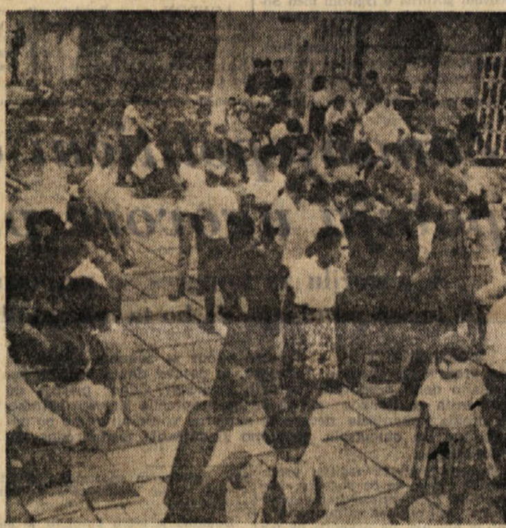
Po stari tradiciji se je študentski sejem v Ljubljani ohranil še naprej. Prodajalci in nakupovalci sta iz knjig se sedaj zbirajo v prejem dvorišču v Križankah. Poleg študentov prodajajo knjige (nove in že rabljene) tu li nekatere založbe