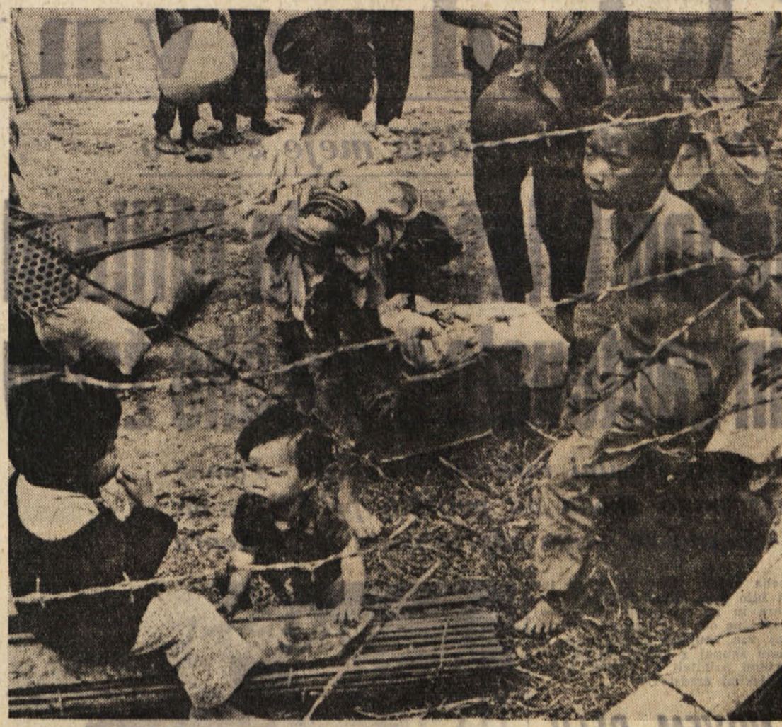
Diemov režim v Južnem Vietnamu pozna tudi takšne metode

DA NISEM IMEL DOVOLJ SAPA, DA BI JI ODGOVORIL. MOČJE SEM HRILOLAZIL DALJE V PREPRIČANJU, DA NE BOM PRIŠEL ŽIV NA VRH TRSTELJA.