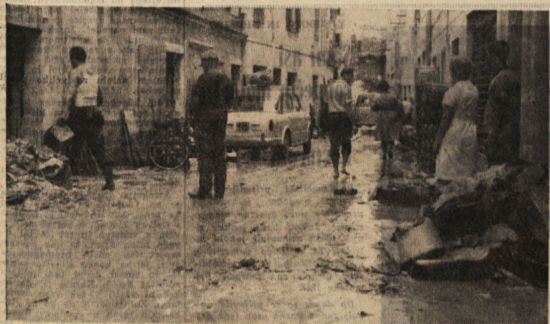
Poleg žavelskega pristanišča je neurje najbolj prizadelo Milje. Voda je preplavila ulice in udrla v številne postopja in posebno v trgovinah povzročila velikansko škodo. Na sliki pogled na eno izmed milj-skih ulic v popoldanskih urah