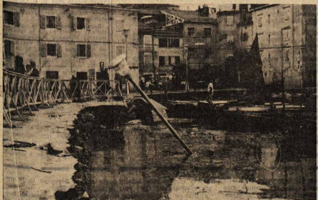
V miljskem portiču se je v dolžini 35 m in v širini od 1 do 3 m udrla obala, v zalivu so se potopili številni čolni, ni pa izključeno, da je na dnu pristana tudi kakšna vespa in celo avto