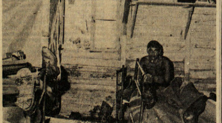
Voda je vdrila v barake delavcev v industrijskem pristanišču

Včeraj so predstavniki CRDA v letalski družbi «Alcarabo» iz Palarma motorno tovarno ladjo «Sandalion», ki ima 36 tisoč ton. To je tretja ladja te vrste, ki so jo zgradili v ladjedelnicih CRDA in