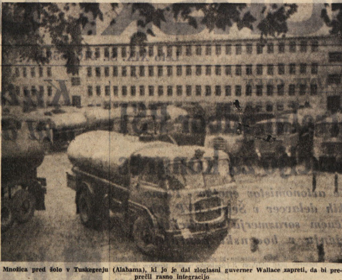
Množica pred šolo v Tuskeegeju (Alabama), ki jo je dal zloglasni guverner Wallace zapreti, da bi preprečil rasno integracijo

Medtem ko se je v Trstu včeraj nabralo veliko štivilo avtocest, ker niso moglo položiti bencina zaradi poplave v Zavljah, pa so imeli v Tortoni gnečo s takimi vozili v nedeljek, ko so prevozniki, ki prevažajo iz Genove bencin v Piemont in druge predele, stakali