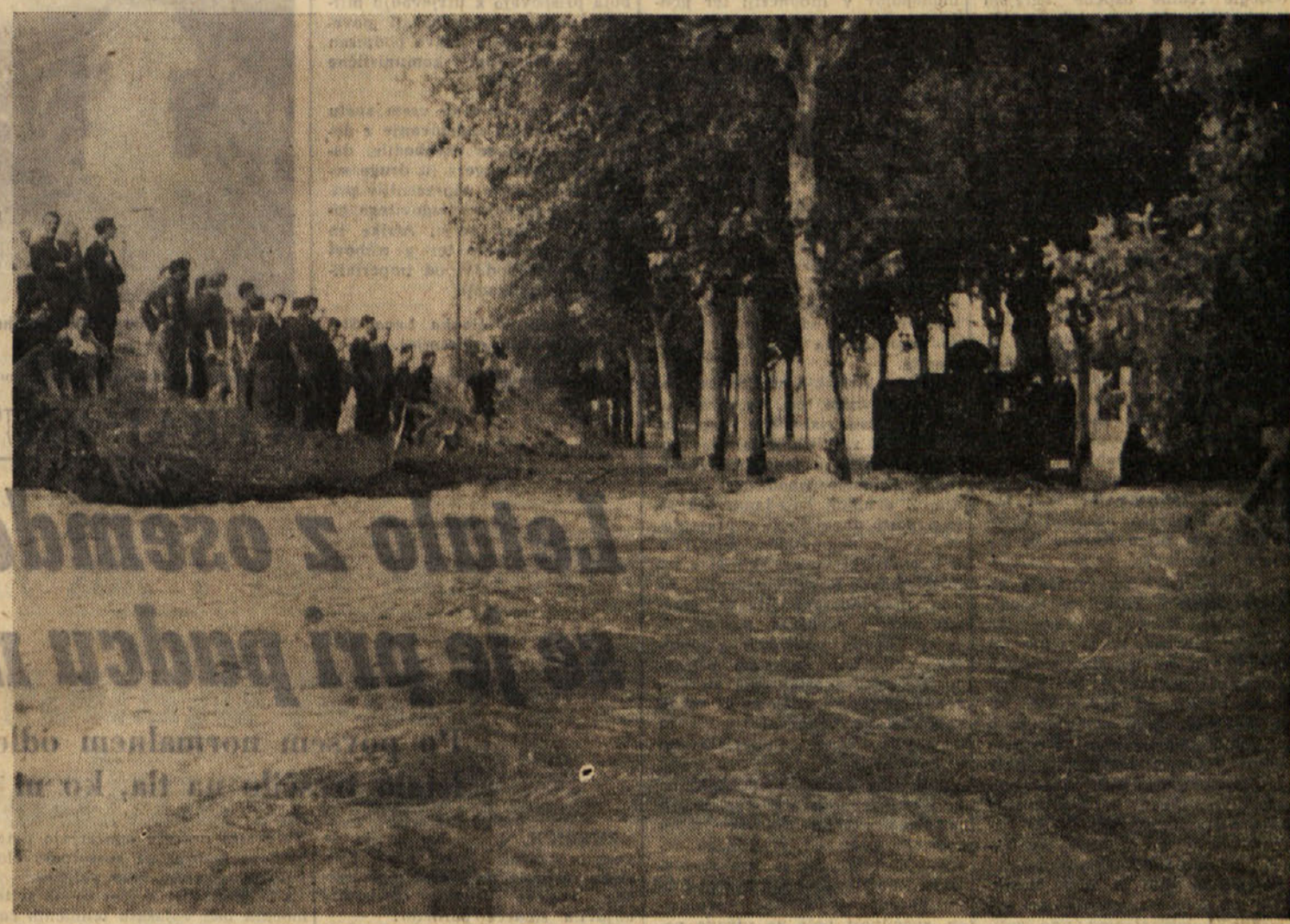
Poplavljena zaveljska cesta blizu bivše tovarne »Gaslin«

Strašno neurje, kakršnega že dolgo let ne pomnimo, je v noči med torkom in sredo zajelo področje: Debeli rtič, Miljski hribi (tostran in onstran meje), Milje, Osapska dolina, Dolina, Boljuneč, Zavlje, Kolonkovec. Huda ura se je začela okrog ponoči in je trajala do prvih jutranjih urah. Voda je pokazala svojo razdiralno silo, terjala je človeško žrtev (en delavec mrtev in trije ranjeni) in je povzročila ogromno škodo, ki je ni moč še oceniti, lahko pa govorimo o stotinah in stotinah milijonov. Največja škoda je vsekakov v industrijskem pristanščju, v Miljah, v dolini Glinščice, v Osapski dolini ter v Ankaranu.