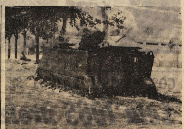
Amfibijsko vojaško vozilo si krči pot v Zavljan

Ob 16.45 je predviden odhod dveh motornih čolnov iz lesnega pristanišča. Če se bosta takoj vrnila v Trst, in če m/l «Dionea» bo ob 18.15 odplula s pomorske postaje, in mimo lesnega pristanišča pripilila v Milje. Če bo potrebno bo na isti pragi vozila ob 19. uri tudi m/l «Edina». Poleg že navedenih ur odhodov in prihodov motornih čolnov, bosta ta dva vozila tudi vsakokrat ko bo potrebno iz lesnega pristanišča do Milj in nazaj.