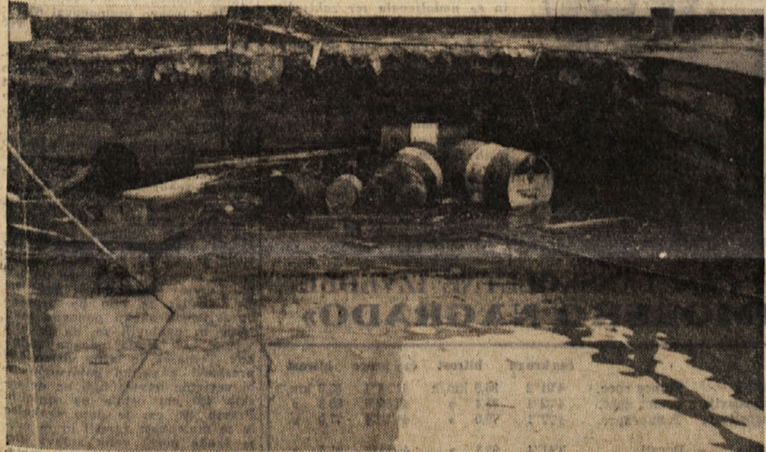
Ob vhodu v Milje nasproti avtofilobusne postaje so se zaradi naliva udrla tla pod bencinsko črpalko in čebesedno pogoltnila črpalko in kioski