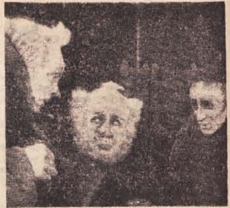
Quayle-Falstaff (v stratfordskem gledališču)

'Henrik IV.', prvi in drugi del, in 'Henrik V.' so bile uprizorjene v isti osnovni inscenaciji, ki so jo dopolnjevali med predstavo le s tem ali onim elementom. Glavno inscenacijo je tvorila konstruktivistična odroska stavba iz lesa, ki je bila v sredini enonadstropna, od koder so različno vjugaste stopnice vodile proti portalom in še na posamezne strani. Prilični srednji del se je odpiral in zapiral s trodelnimi vratnimi stranicami, ki so tako mogle dobiti zelo različno obliko. Posamezni deli te stavbe so bili povezani z ozkimi lesenimi stebriči, na levi in desni strani portala je bil oder z nizkim praktikablom. Na levem so se