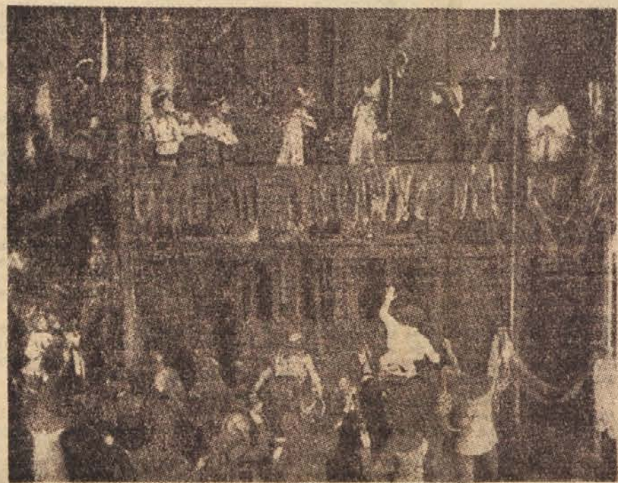
Kronanje Henrika V. (v stratfordskem gledališču)

Prizadevanje po takšni odsko-inscenacijski stavbi, ki bi sicer ne bila tako toga, kakor je zgodovinsko elizabetinska, ki bi pa vendarle ne kršila enotnosti in poteka dejanja, dala pa hkrati vendarle v okviru moderniziranega elizabetinskega sistema maksimalno iluzijo prizorišča — to je glavno režijsko-inscenacijsko prizadevanje sodobnega angleškega režiserja pri Shakespearu sploh. Ne okrnjevat Shakespeara na račun inscenacije in njenih efektov, marveč z vsjo moderno odsko tehniko in osvetljava pripomoči Shakespeareovemu delu, da čim bolj oživi pred sodobnim gledalcem v vsej svoji veličini in homogenosti, igralec pa da ustvari dinamičen odroski prostor. Ne spreminjati zaradi veristične scene njegovih notranje tesno povezanih, čeprav na zunaj nasprotnih prizorov v posamezne slike, ki so sicer lahko zelo lepe in učinkovite, ki pa trgajo Shakespeareovo delo na kose, na slike in premore, ki ga drobijo, kakor če bi drobili stavke Beethovnovih simfonij. Različna so pota, ki vodijo k čim bolj enotnim inscenacijam, toda kljub ožinam je še vedno dovolj prostora za invencioznost tudi v tej smeri. O tem so pričale med drugim tudi letošnje stratfordske uprizoritve tetralogije. Vse štiri igre ('Richard II.,