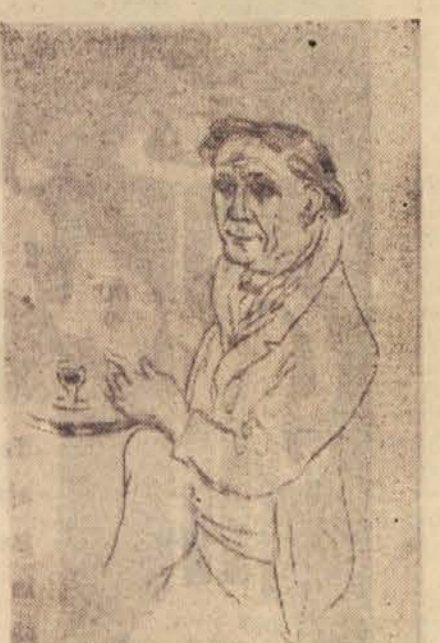
Veno Pilon: Picasso na obisku v kavarni (suha igla)

Iz umetniškega rodu po prvi svetovni vojni, ki je dobil ime »ekspresionisti«, se dviga postava slikarja in grafika Vena Pilona. Njegova dela iz tega časa vsijo v naši »Moderni galeriji« in nam kažejo podobe Kraševca, ki gleda na svet kot na monumentalno prizorišče v naravi danih oblik ter lastnega, včasih melan-