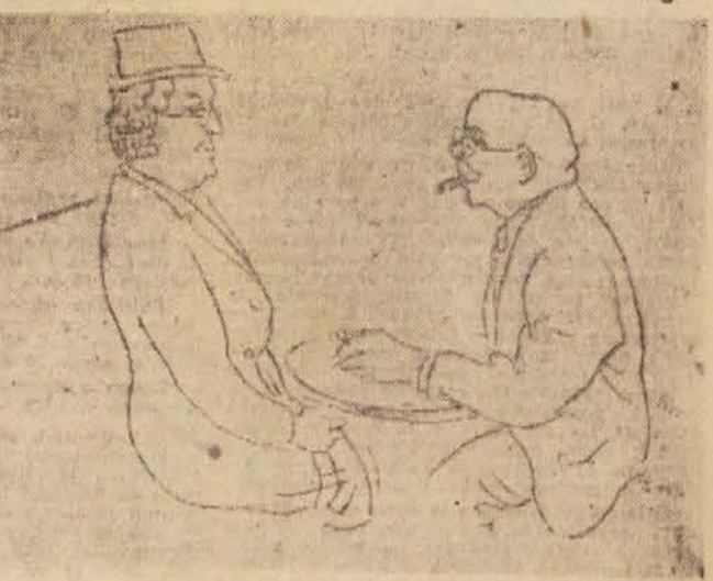
Veno Pilon: Med štirimi očmi (suha igla)