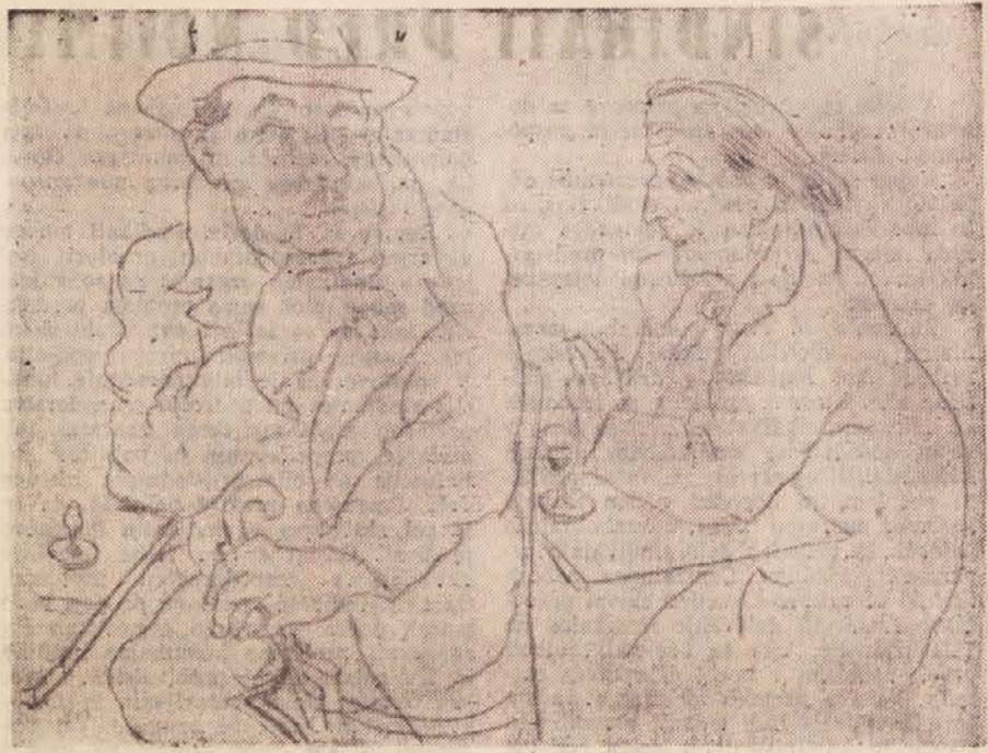
Veno Pilon: Buržuj in intelektualac (suha igla) — Iz zbirke »Montparnasse« (glej članek na str. 9)