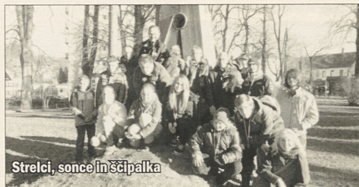
Strelci, sonce in ščipalka

Medtem ko se je minulo soboto, 14.12.2013, Obala dušila v megli, se je pregovorno mrzla Postojna kopala v soncu. Morda je tudi to pripomoglo k odličnim rezultatom, ki so jih dosegli izolski strelci na 3. kolu Primorsko - Notranjsko - Kraške Regijske lige Zahodne Regije v streljanju z zračnim orožjem, ki je sicer pote-