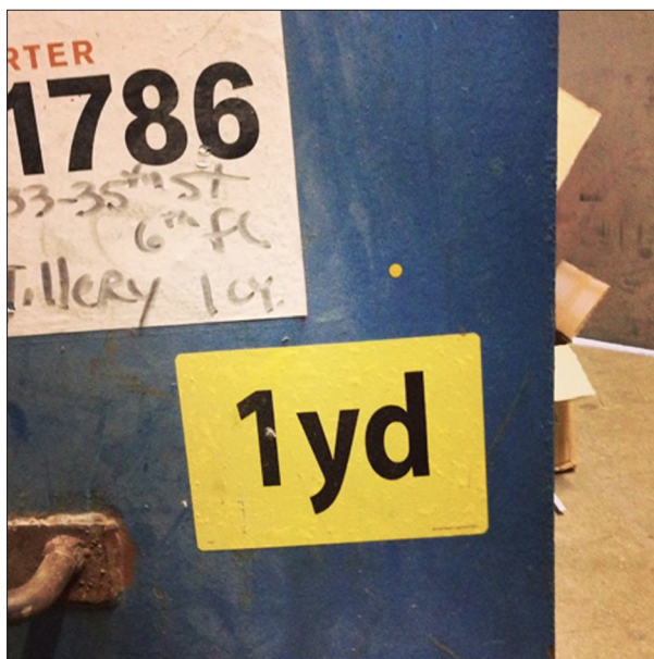
Pika je konceptualno vedno točka: 1d.

Čeprav tako preprosta oblika umetnine, kot je enobarvni krog, pušča odprto polje za različne interpretacije, se njen pomen sokonstituira tudi v avtorjevih