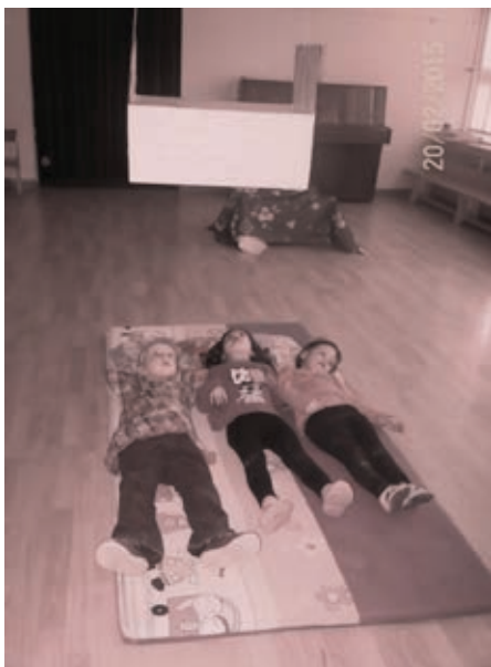
Slika 8: Spoznavamo: Modra vaza (slikar: Paul Cézanne)