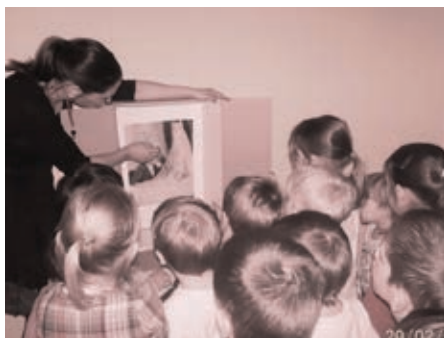
Slika 3: Spoznavamo: Zibelka (slikarka: Berthe Morisot)