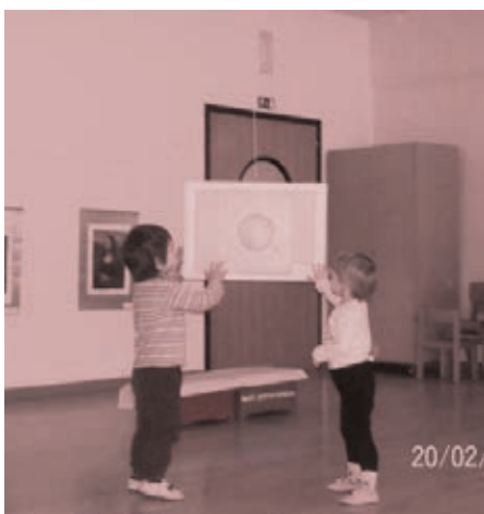
Slika 9: Spoznavamo: Rekonstrukcija veselja (avtor: Giacomo Balla)