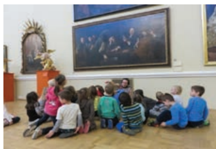
Slika 11: Spoznavamo: na obisku v Narodni galeriji

Otroci so občudovali slovesne, veličastne galerijske prostore. Ugotavljali so tudi, da so v galeriji razstavljenе lahko zelo velike slike, spraševali so me, kako jih prinesejo v galerijo in kaj se zgodi, če se kakšna slika poškoduje.