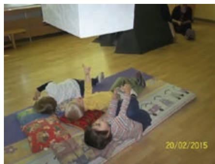
Slika 7: Spoznavamo: Modra vaza (slikar: Paul Cézanne)