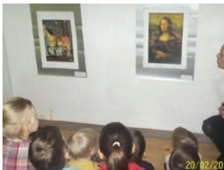
Slika 2: Spoznavamo: Mona Lisa (slikar: Leonardo da Vinci)

Otroci so ob opazovanju dajali različne komentarje: