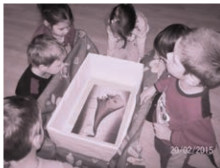
Slika 10: Spoznavamo: Zaspana slika (slikar: Salvadore Dali)