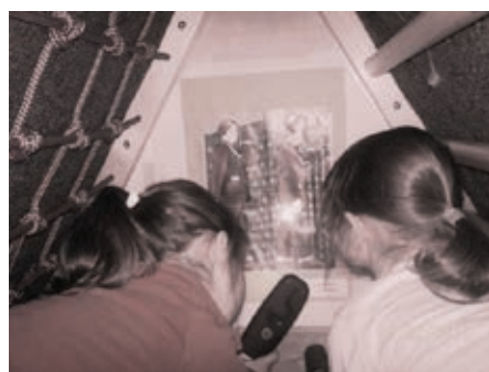
Slika 5 in 6: Spoznavamo: Kazanje oslov (avtorja: Gilbert & George)